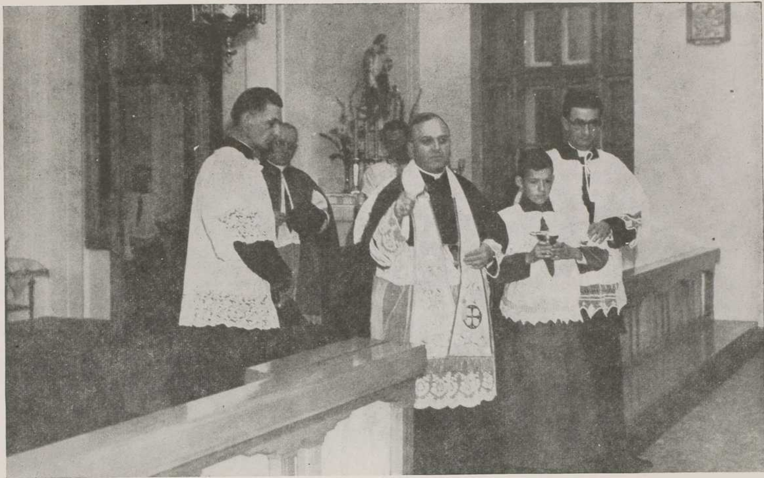
S. EXC. MGR G. MELANÇON PROCÈDE À LA BÉNÉDICTION SOLENNELLE DE LA NOUVELLE MAISON DE RETRAITES FERMÉES DES SŒURS MISSIONNAIRES DE L'IMMACULÉE-CONCEPTION À CHICOUTIMI.