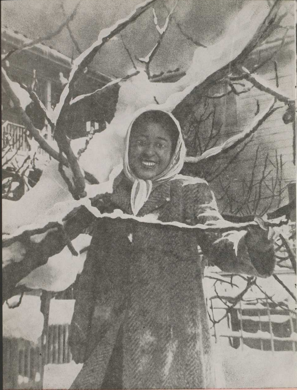
Après une bordée de neige à Koriyama, Japon.