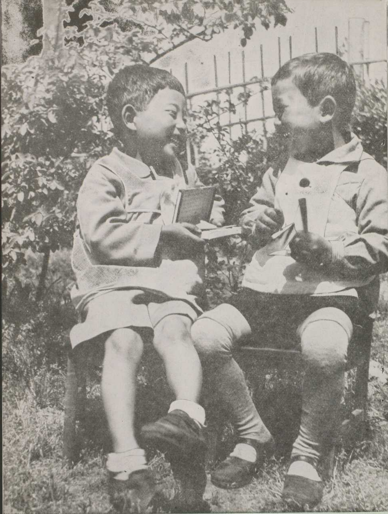
Deux bons petits amis du Jardin de l'Enfance des Soeurs Missionnaires de l'Immaculée- Conception de Wakamatsu.