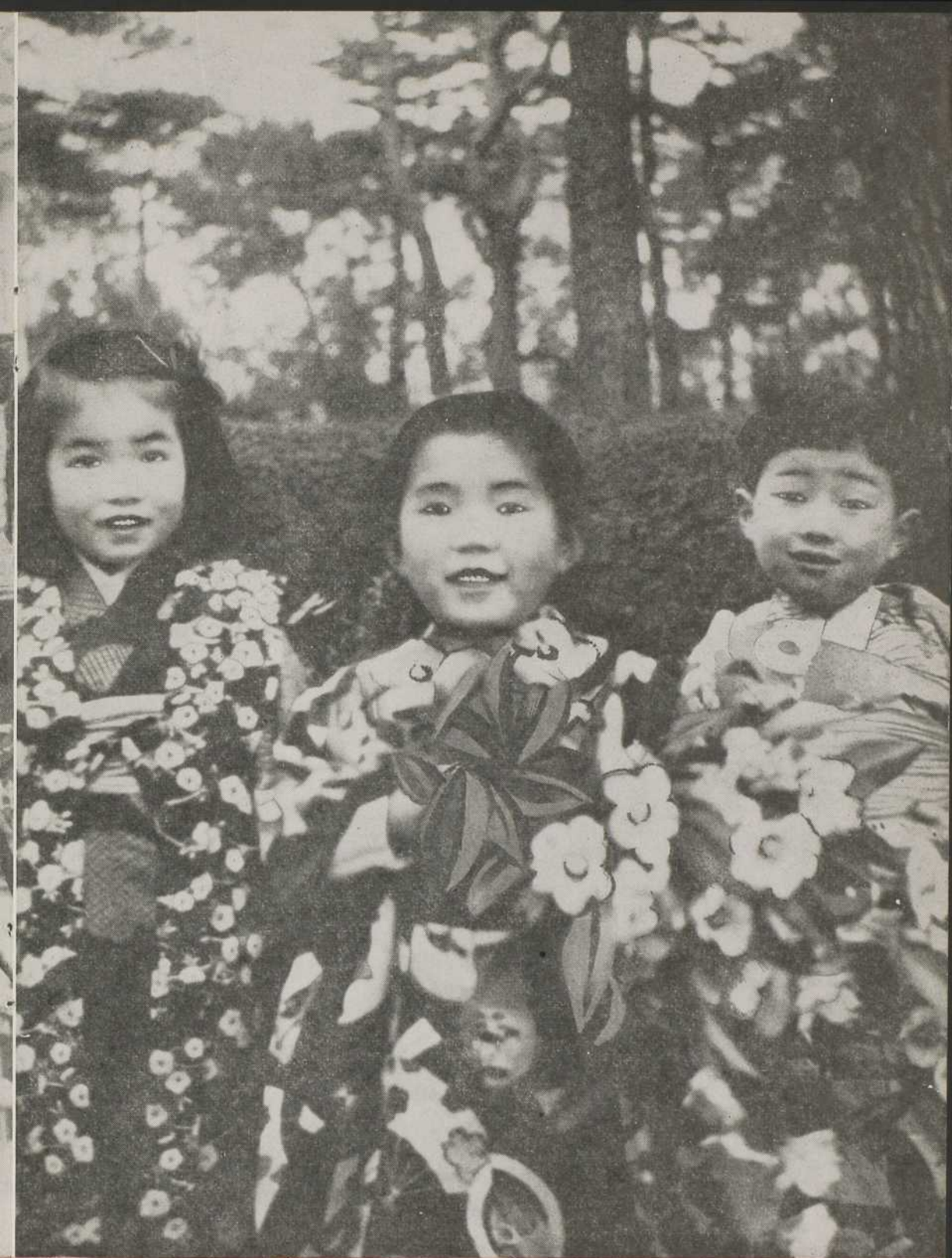
Ces trois bambins de Tokyo offrent à leurs Bienfaiteurs d'outre-mer la gerbe parfumée de leurs vœux ardents et de leur profonde reconnaissance.