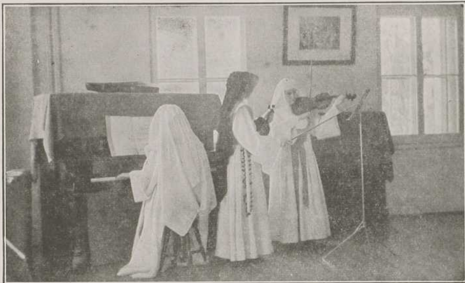
LES VIOLONISTES EXERCENT LEUR TALENT.

A 8 h. 45, répondant aux sons joyeux de la cloche, nous entonnons notre traditionnel cantique: « Ah! qu'il est bon, qu'il est bon le bon Dieu! » Puis, après les premières effusions de joie et les babils les plus animés, chacune donne libre satisfaction à ses attraits naturels: les studieuses courent aux classes, d'autres écrivent, lisent, ou font de la musique. « Vous êtes libres! » nous a dit notre Maitresse ce matin. Être libre, quelle douce chose! L'on