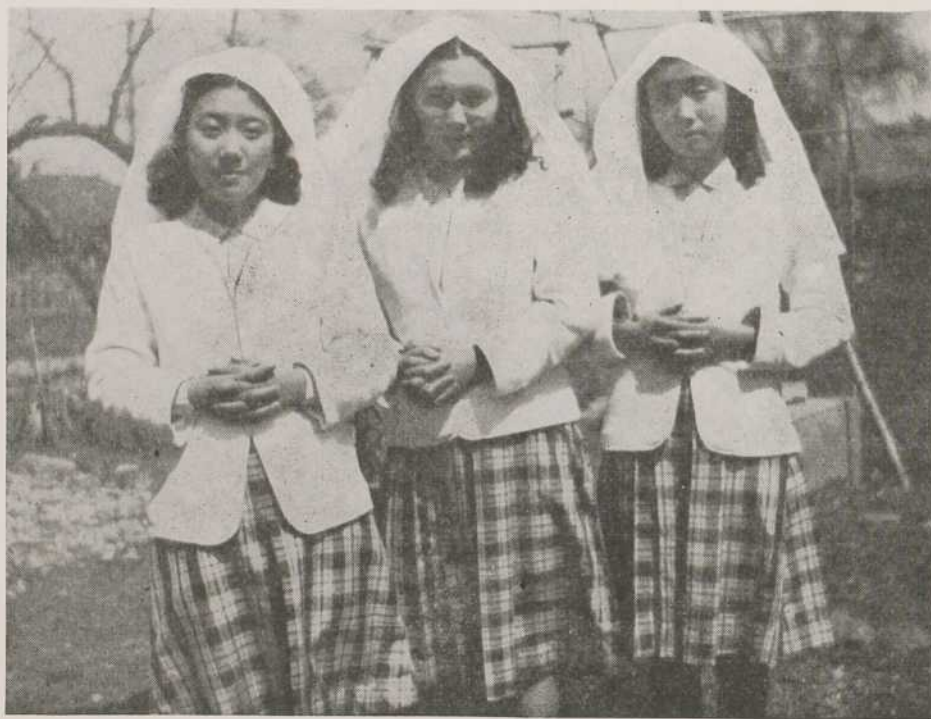
TROIS SŒURS BAPTISÉES LE MÊME JOUR, À WAKAMATSU, AU JAPON.

Un jour, notre Sœur couturière, surchargée de travail, cherchait quelqu'un qui pût l'aider dans la confection du costume des élèves du Jardin de