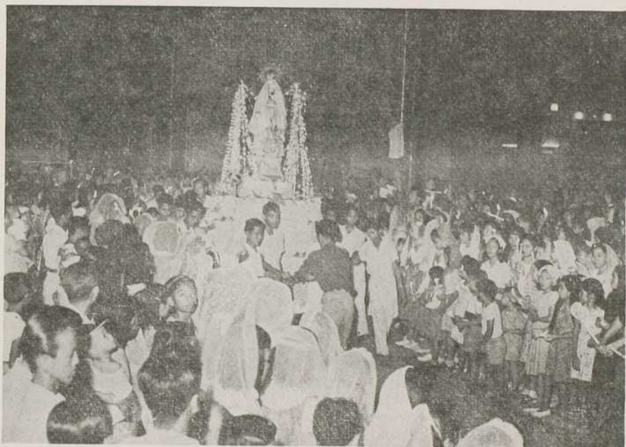
VUE DE LA FOULE MASSÉE À LA PORTE DE L'ÉGLISE DE GAGALANGIN, À L'ARRIVÉE DU CHAR DE LA VIERGE.

Mais que sont devenus les angelots que nous avons tout à l'heure admirés près de l'autel? Bambines du Jardin de l'Enfance, leur part devait se borner au rôle de gardes eucharistiques; mais elles ne l'entendirent pas de la sorte: insistant auprès de leurs parents, elles se mêlent aussi à la procession. Et l'on peut voir, de distance en distance, un ange rose, blanc, bleu ou vert relevant sa longue robe et s'empressant à marcher au pas général. D'autres bambins, ceux de la première année, jugés trop petits pour par-