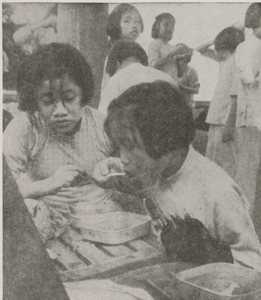
DANS LA RUE, À CANTON, EN CHINE.