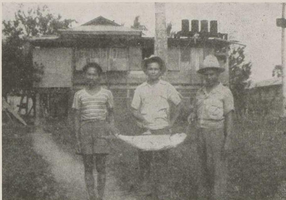
CES JEUNES GENS DE MATI VIENNENT DE CAPTURER UN BEAU POISSON DU POIDS DE DOUZE KILOS. À L'ARRIÈRE-PLAN, LE COUVENT DES SŒURS MISSIONNAIRES DE L'IMMACULÉE-CONCEPTION.

à l'Ange Gardien auxquelles s'accroche le refrain Bubble gum ! Entre chaque numéro, les duettistes s'applaudissent très chaudement ! Il nous semble que la Sainte Vierge doit sourire à ces deux chers innocents et bénir ce foyer où autrefois l'on ne savait pas prier.