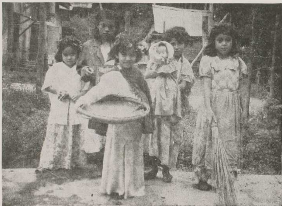
JEUNES PENSIONNAIRES DE L'ACADÉMIE DU CŒUR IMMACULÉ DE MARIE À MATI, DAVAO, JOUANT À LA « MADAME ».