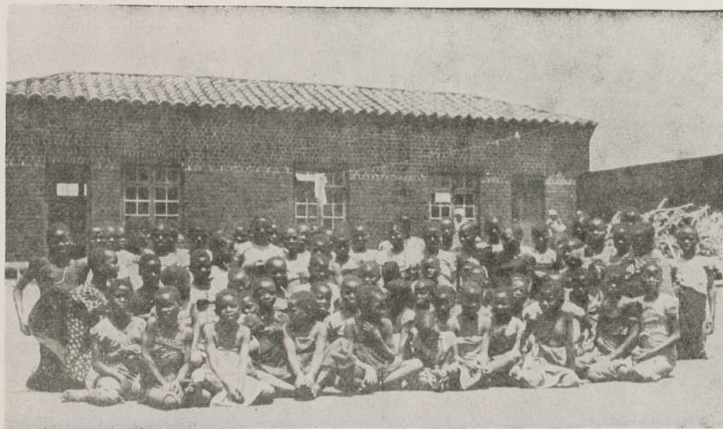
LES ÉLÈVES DU BOARDING, À KATETE, AU NYASSA-NORD.

Le samedi, c'est jour de lessive. En l'occurrence, notre Bendix , c'est la rivière Katete. On trempe son saru dans l'eau, puis on le tape très fort, en tous sens, sur une grosse pierre: le savon est aussi rare qu'à l'heure de la toilette. Ensuite, on tord le linge et on le secoue au vent pour qu'il puisse sécher plus vite... Vu la pauvreté des Noirs, un très petit nombre seulement possèdent deux saru .