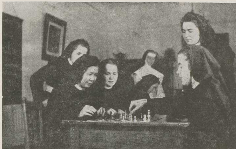
UNE PARTIE D'ÉCHECS AU POSTULAT...

Trente-six nouvelles postulantes, guidées sans doute par l'Étoile de la Mer, viennent s'enrôler aujourd'hui dans notre cher Institut dont la devise brille du plus pur idéal missionnaire et marial: « Que la Vierge Immaculée soit connue d'un pôle à l'autre! »