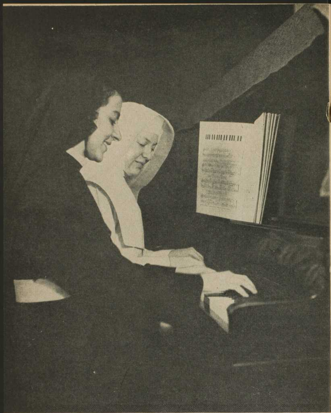
Novices et postulantes exercent leurs talents en art musical