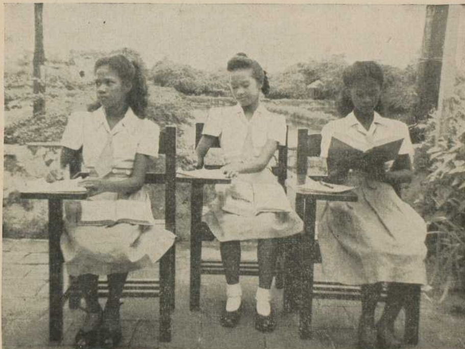
ÉLÈVES DE LA HIGH SCHOOL À LAS PINAS, ÎLES PHILIPPINES.

La terre philippine est pleine de promesses. La Foi que les Espagnols sont venus y implanter au XVI e siècle s'est transmise de génération en génération,