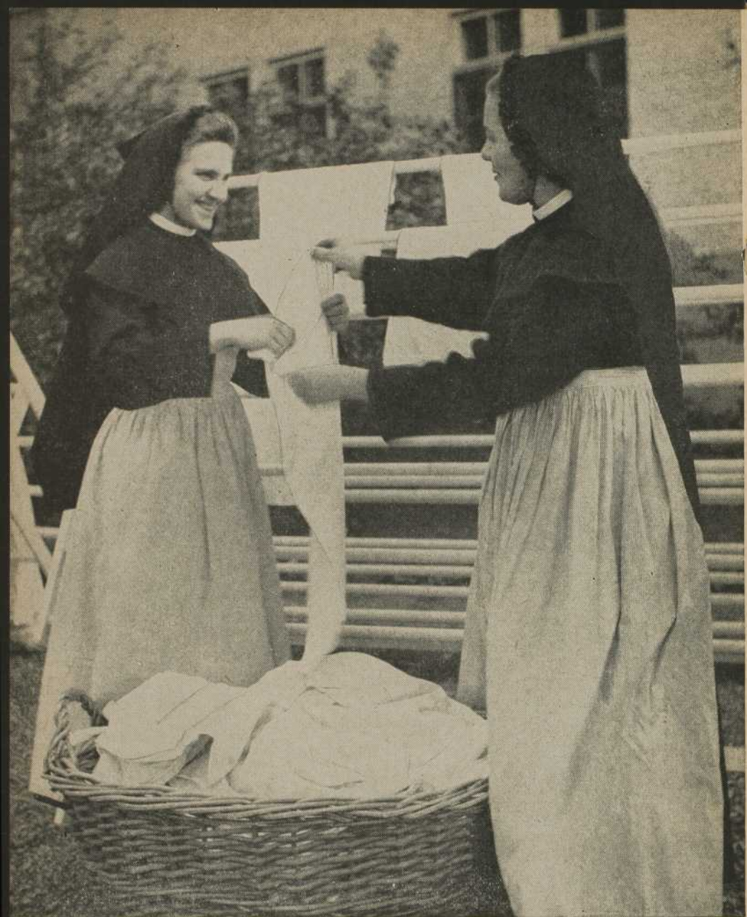
Les beaux jours du Postulat