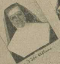
S. Ste. Anne