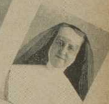
S. Jean Eude