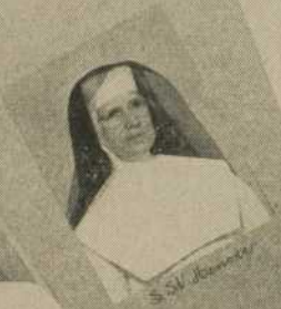
S. St. Rose