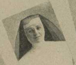
S. Cecile des Anges