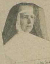
S. Marie des Saints