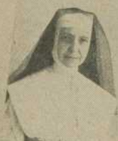
S. Marie Madeleine