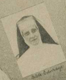
S. Ste. Eulalie