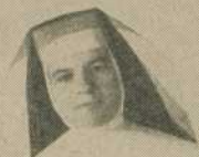
S. St. Bernard