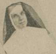
S. St. Anne