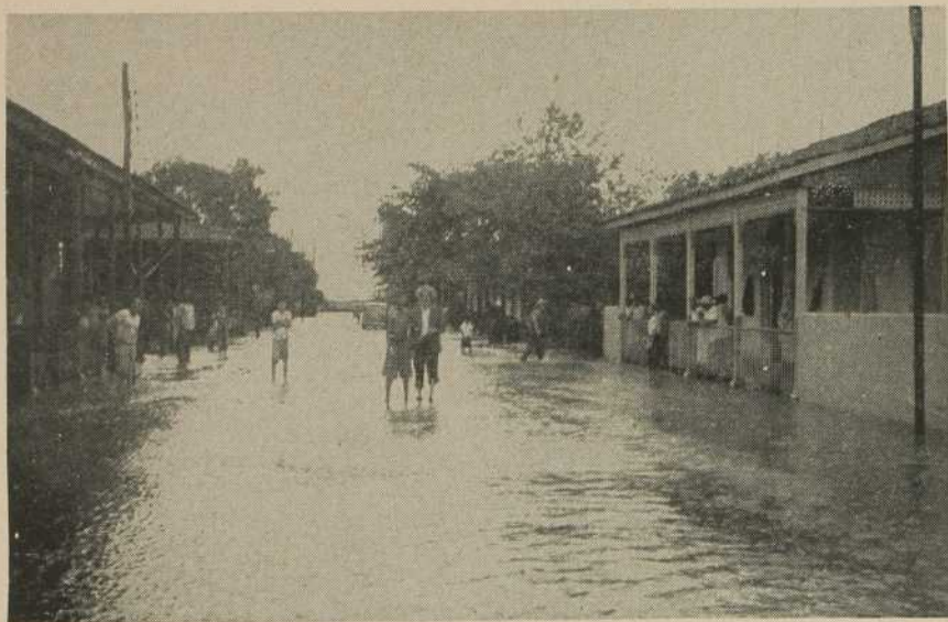
L'INONDATION À MANGUITO, CUBA.

Rue Esperanza, les flots pénètrent à l'intérieur de la voiture. Ici les gens se baignent comme à la plage. Le torrent court très vif, entrant dans les maisons par la porte d'en avant et en ressortant par celle d'en arrière. Partout se voient des meubles entassés les uns par-dessus les autres ou accrochés au plafond : chaises, radios, machines à coudre, etc. Malgré la situation assez désastreuse, on cause amicalement accoudé aux fenêtres. Ailleurs, des familles entières sont installées sur des lits pour la journée.