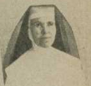
S. Marie de la Paix