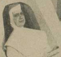
S. Marie de Bonlieu