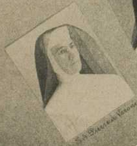
S. St. Theresia