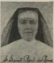
S. Saint Paul de Rome