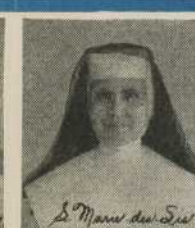
S. Marie des Sés