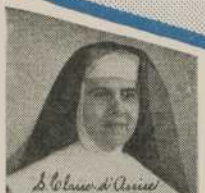
S. Claire d'Assise