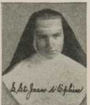
S. St. Jean d'Epheus