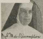
S. M. de l'Assomption