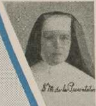
S. M. de la Purite