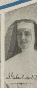
S. Gabriel des Trinités