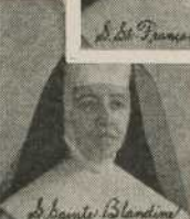
S. Sainte Blandine