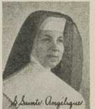
S. Sainte Angeliqes