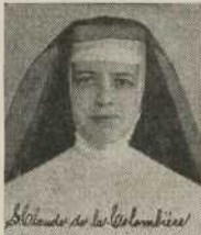
S. Claude de la Colombie