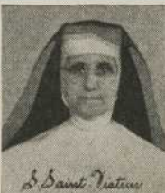
S. Saint Victoire