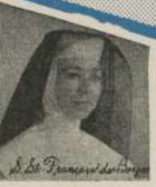
S. St. Francois de Sales