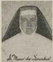
S. Marie de Lourdes