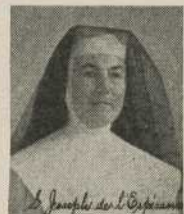
S. Joseph de l'Espérance