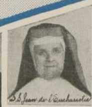
S. Jean de l'Escharotte