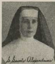
S. Sainte Alexandrine