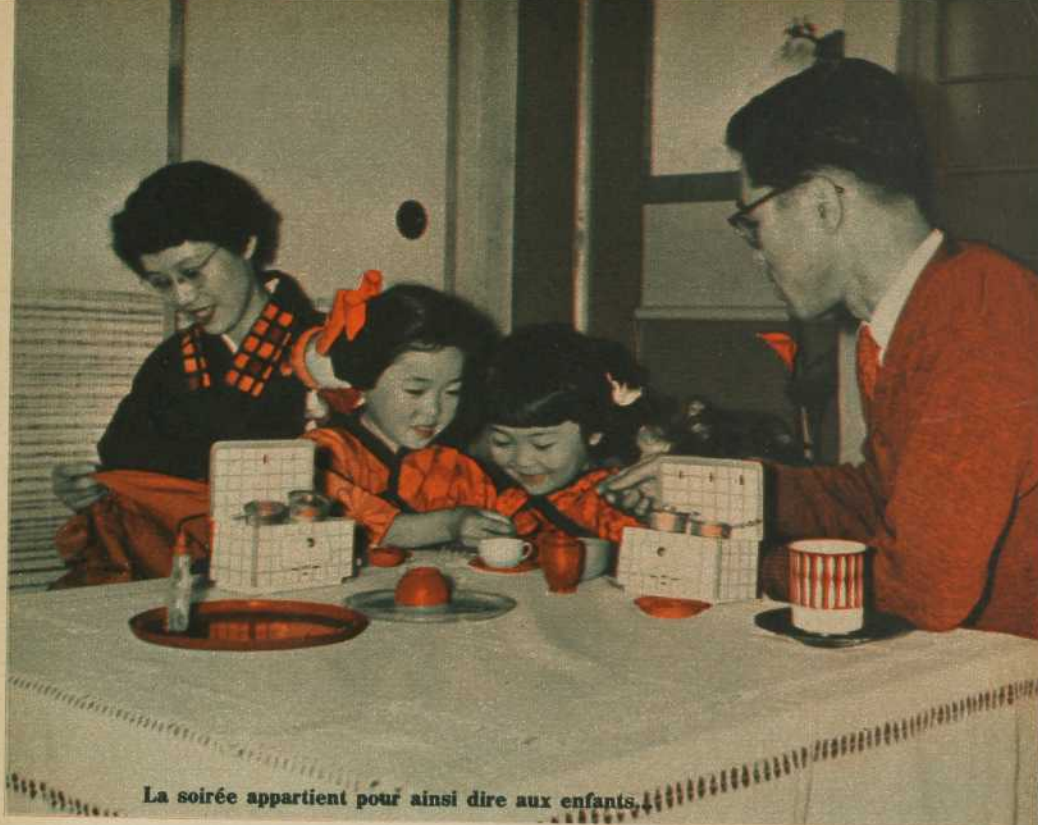
La soirée appartient pour ainsi dire aux enfants.

La soirée appartient pour ainsi dire aux enfants: on s'informe de leurs progrès en classe, des matières étudiées durant le jour; on aide leur inexpérience, on stimule leurs efforts dans l'apprentissage du dessin, de la calligraphie, etc. Maman raconte les prouesses des tout petits auxquelles le père applaudit sans trop de paroles. Il aime balancer le bébé sur ses genoux, mais pour l'ordinaire, il ne joue pas avec ses enfants, afin de sauvegarder sa dignité de chef.