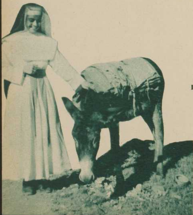
Des montagnes les plus élevées de petits ânes apportent les marchandises à la ville.

Donc, vous tous qui vous nourrissez, sans rationnement, du pain spirituel et du pain matériel, n'oubliez pas la détresse de nos Indiens privés de l'un et de l'autre. Car si à côté de l'abondance sévit l'indigence, c'est pour que le riche partage avec le pauvre. Une main secourable tendue vers la terre bolivienne, un cœur d'apôtre prêt à aider les missionnaires dans leur apostolat, et voilà que le Pater s'accomplit, devient vivant, et que le pain est rompu entre frères de la famille des enfants de Dieu.