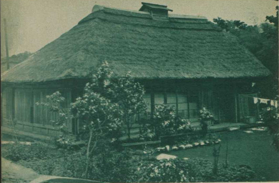
Maison de paysans au Japon.

Comme ameublement, à peu près rien. Au fond de la pièce principale, le tokonoma , sorte d'alcôve, abrite un vase à fleurs et quelques œuvres d'art: riche sculpture, peinture ancienne, objets de laque ou d'ivoire. La table basse et les rares meubles n'apparaissent que le temps nécessaire par leur usage.