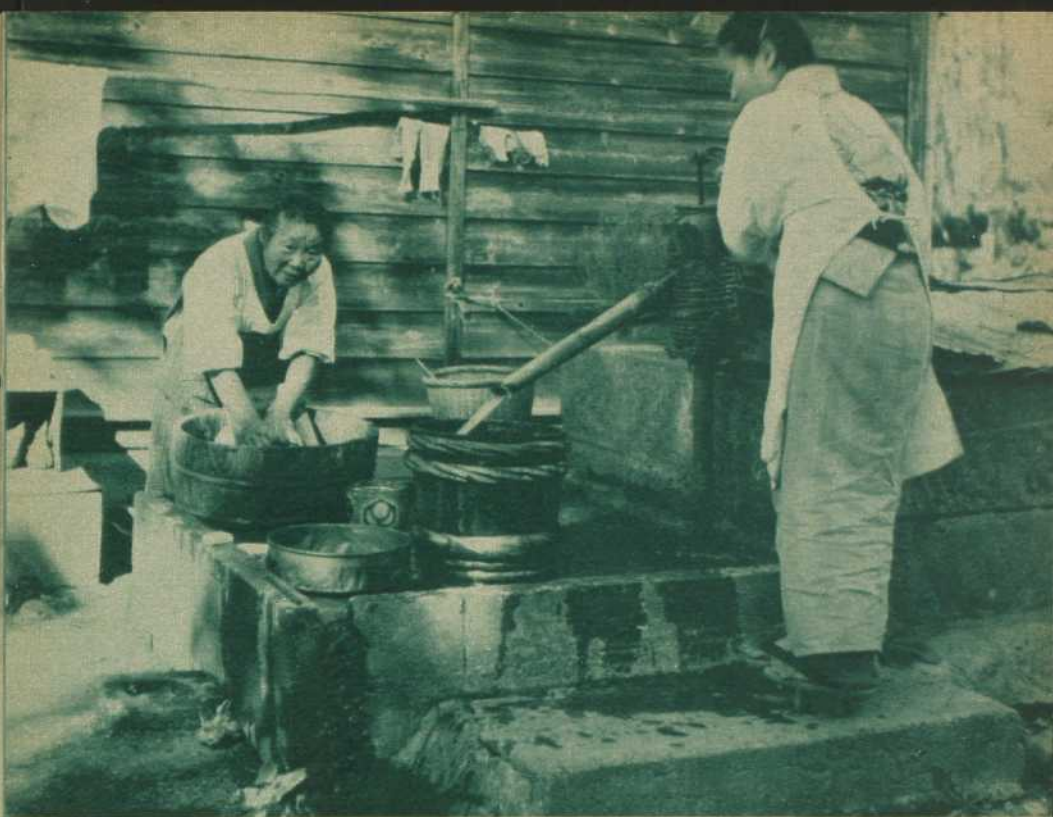
La corvée de blanchissage.

l'autre, c'est sous un jour déformé plus propre à les éloigner du catholicisme qu'à les y attirer.