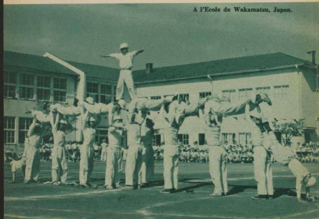
A l'École de Wakamatsu, Japon.

Les étudiantes — y compris celles de l'École supérieure — gardent pour la plupart les cheveux tressés et n'usent d'aucun fard, pas même du bâton de rouge. La jeune fille qui accepterait un rendez-vous au