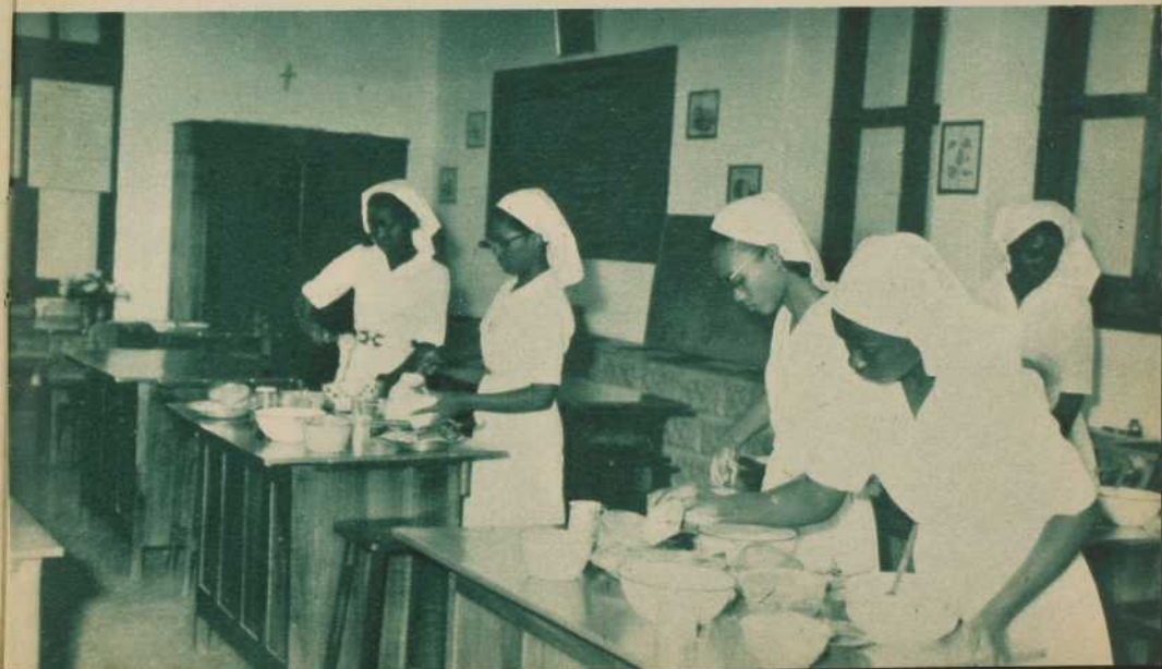
Classe d'art culinaire à l'Ecole classico-ménagère du Cap-Haïtien.