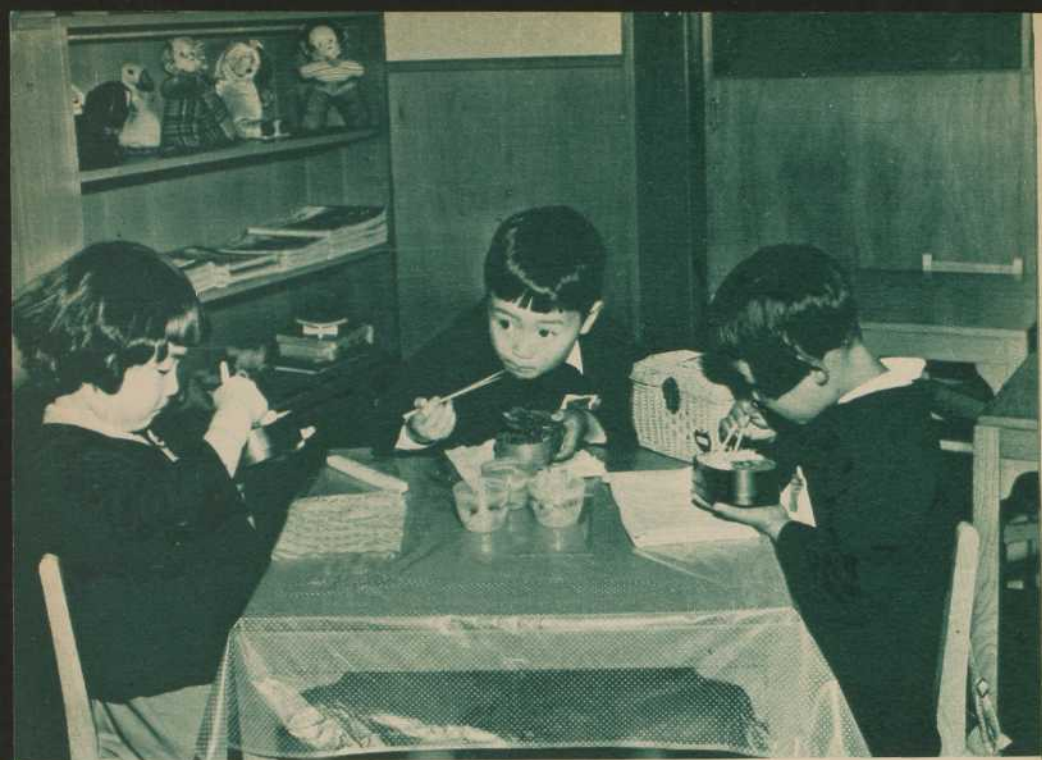
Le midi, chacun déguste son BENTO, soit à l'école, soit à l'usine...

sonnels. Vient ensuite la fête du 31e jour pour un garçon, du 32e pour une fille. Revêtu d'un kimono de soie noire, l'enfant est porté au temple shintoïste pour une visite aux dieux de l'Empire. Puis c'est le Shichi-gosan (7-5-3), fête des garçonnets et fillettes qui ont sept, cinq ou trois ans. Habillés de kimonos éclatants, ils vont solliciter la protection des divinités du pays. En leur honneur, on monte des étalages où figurent quantité d'objets porte-bonheur; on les gave de biscuits, de bonbons et autres friandises.