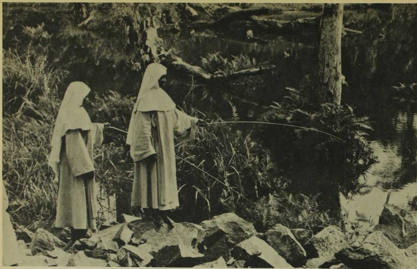
Moments de détente chez les Clarisses de Lilongwe.