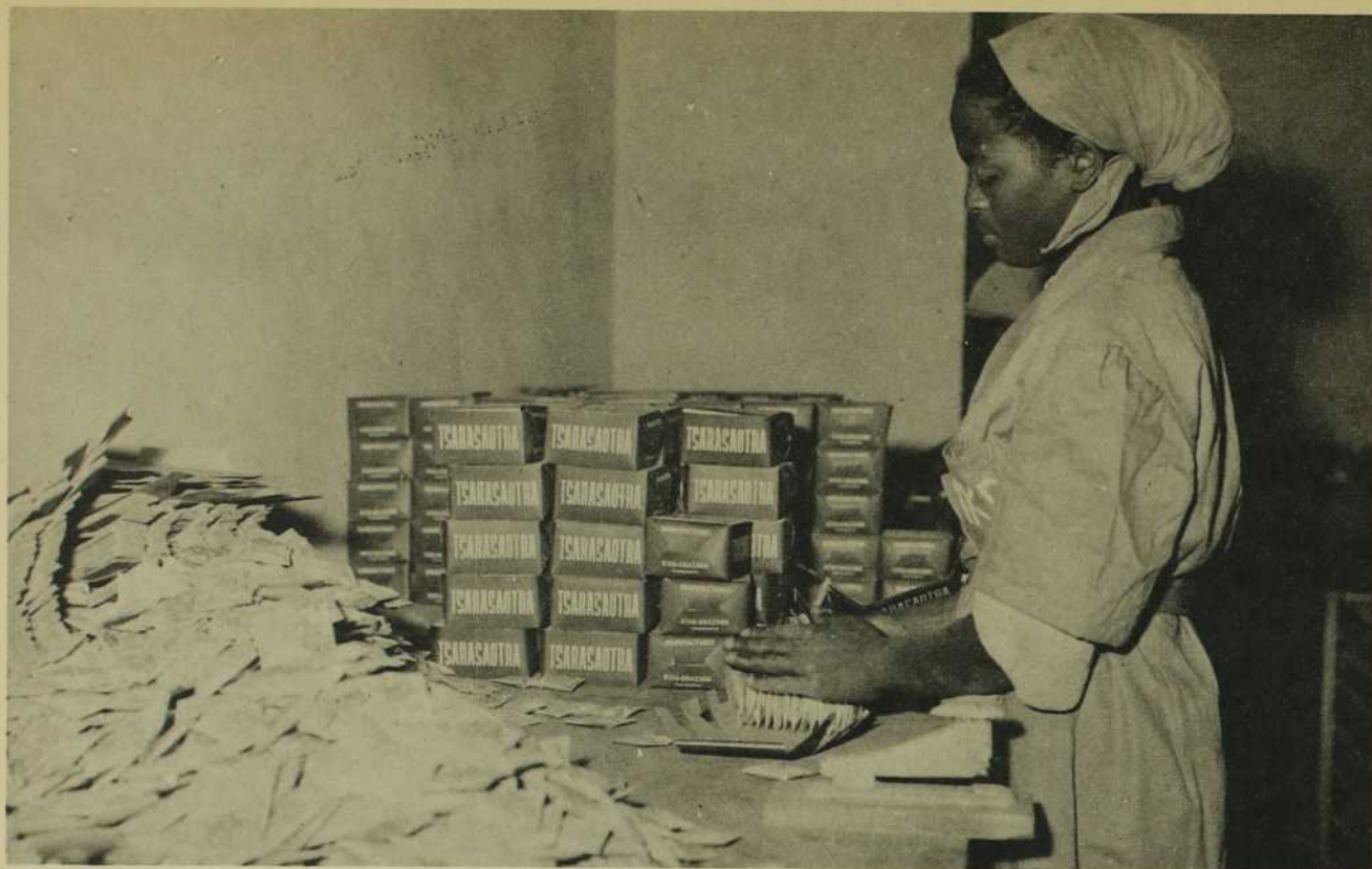
Manufacture de tabac.

LA FEMME MALGACHE EXERCE LE COMMERCE. NOMBREUSES SONT LES TITULAIRES DE PAVIL- LONS DANS LES MARCHES.