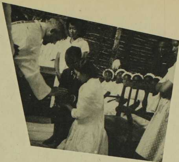
Le mariage décidé autrefois par les deux clans familiaux se fait maintenant sur l'initiative des futurs conjoints.

Une fois mariée, toute l'attention se porte moins sur son rôle d'épouse que sur son aptitude à devenir mère. Que de démarches ne ferait pas la jeune épouse si une maternité ne s'annonçait rapidement après le mariage! Il existe encore bon nombre de coutumes qui habilitent très tôt la fillette aux responsabilités maternelles, et des pratiques qu'on croirait d'un autre âge survivent au sein du christianisme et de la civilisation dite moderne; ainsi, en bien des milieux, la femme a d'autant plus de chances de devenir l'épouse définitive d'un homme qu'elle a auparavant fourni la preuve