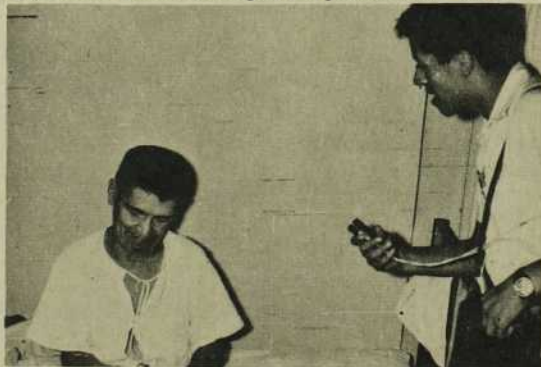
Un patient interviewé par un journaliste de Presencia .