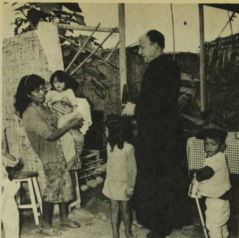
Une maman indienne reçoit le missionnaire.

face à la cathédrale, où le matin de ce dimanche solennel groupa une assistance nombreuse à la Concélébration Eucharistique.