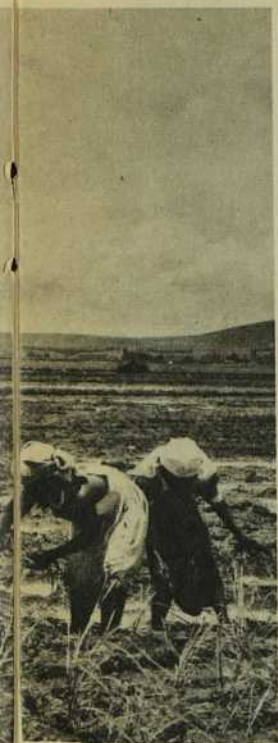
La femme du paysan participe à tous les travaux agricoles.