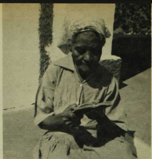
La femme haïtienne si sensible à l'amour, si vibrante de foi n'est-elle pas le jardin idéal pour y semer la vérité?

danse semble être l'amusement préféré. Elles aiment beaucoup chanter. Leur répertoire peut aller jusqu'à une centaine de chansons. Elles les apprennent très vite, car le rythme est inné chez elles. Le samedi, la majorité des petites filles s'occupent de travaux de lessive et de repassage. Elles s'entraînent de bonne heure à la couture: robes de poupée pour lesquelles elles savent utiliser les plus petits chiffons, ourlets pour aider maman et même raccommodage. La fillette en général est très débrouillarde: on en a vu coudre avec une épine d'oranger faute d'aiguille... Elle est éminemment sociable: elle aime la compagnie des amies. A la maison, on l'a formée sévèrement au respect des personnes âgées. Si elle appartient à la classe moyenne ou pauvre, elle sera de bonne heure entraînée à faire le marché et même le commerce pour sa maman. Elle a toute la tenue nécessaire pour ces charges. De la réserve, la femme haïtienne en donne l'impression tout au long de son existence... son mystère, elle le garde! Bien avisé sera celui qui le dénouera! Et pourtant une simplicité charmante lui fait voir la réalité tout en nourrissant beaucoup d'idéal.