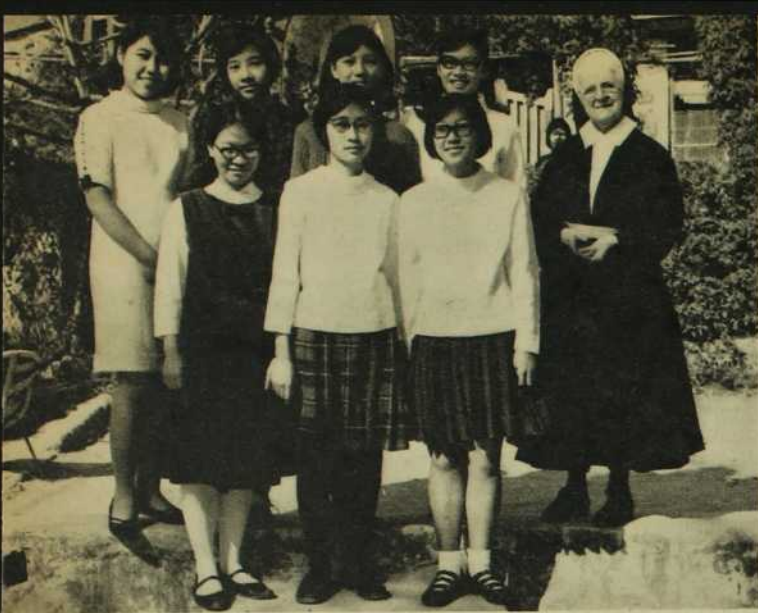
La persévérance courageuse au service de la mission n'est-elle pas une des principales exigences de la vocation missionnaire?

objectivement, une grande différence entre un engagement temporaire et un engagement total et définitif. Il en résulte qu'on peut appliquer ici par analogie ce que la Constitution Lumen Gentium affirme au no. 44, de la consécration religieuse: « L'engagement menant à l'activité missionnaire sera d'autant plus parfait qu'il implique des liens plus fermes et plus stables. » Par ailleurs, le bien de l'Eglise exige aussi qu'on distingue la nécessité et la valeur d'un engagement perpétuel: en effet, le travail missionnaire demande ordinairement une longue préparation, une adaptation et une persévérance courageuse, soutenue par une grande énergie. Cette exigence de demeurer fidèle à la vocation missionnaire durant toute sa vie ne contredit pas ce qui est dit, à d'autres endroits, de l'assistance temporaire aux missions: en effet, dans ce passage-ci, on parle de l'idéal missionnaire tel que nous le trouvons dans l'Écriture et tel que l'exige le travail missionnaire, proprement dit; ailleurs on vise plutôt à encourager tous ceux qui prennent part, à titre temporaire, à ce même travail missionnaire. Enfin, la Commission peut accepter des modifications de textes qui améliorent l'expression des idées, mais non pas celles qui changent des idées, approuvées à une grande majorité en Congrégation Générale. Par conséquent, le texte est maintenu. »