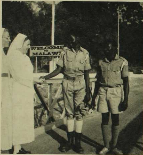
par Sœur Thérèse Blais, M.I.C.