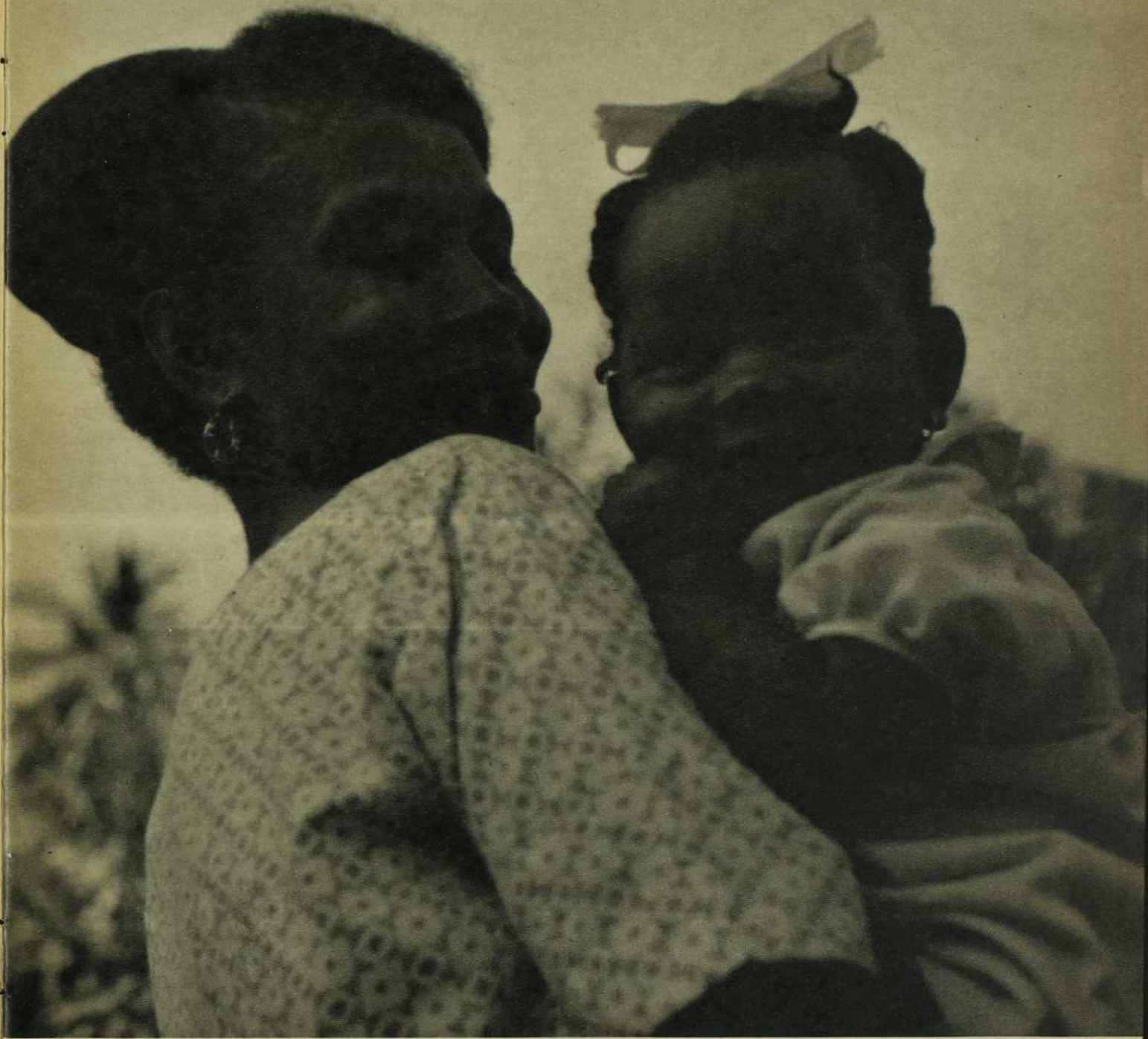
Elle est très coquette pour lui.