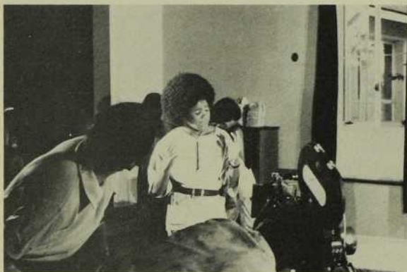
Techniciens et techniciennes à l'œuvre à Multimedia.