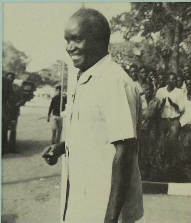
Les jeunes acclament joyeusement celui qu'ils appellent affectueusement K.K.