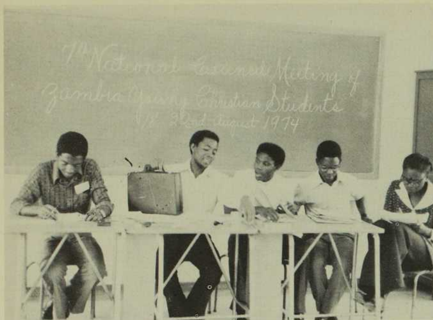
Un groupe de jeunes participants du Concile national de la Zambie.