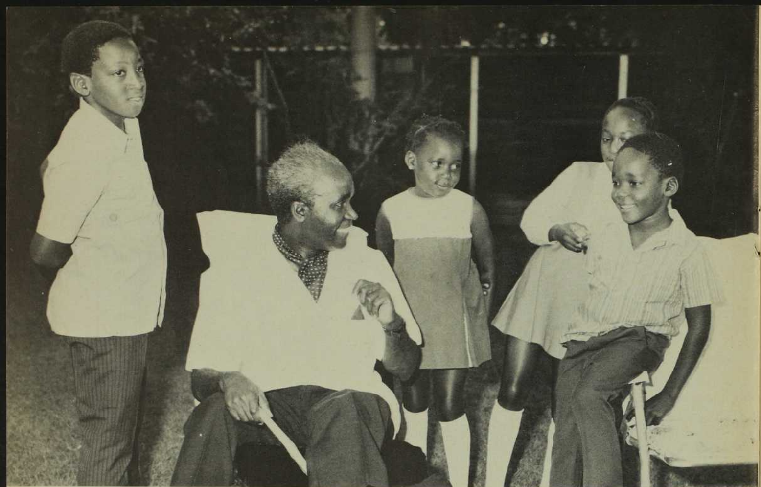
Le Président Kaunda visiblement heureux au milieu de ses enfants.