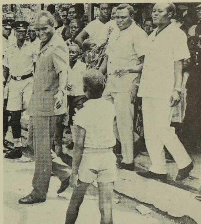
Le Président de la Zambie a conquis la jeunesse de son pays par la confiante affection qu'il lui témoigne.