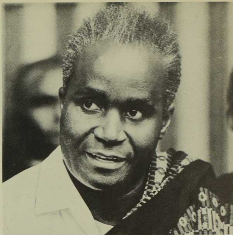
Service de l'Information de la Zambie.