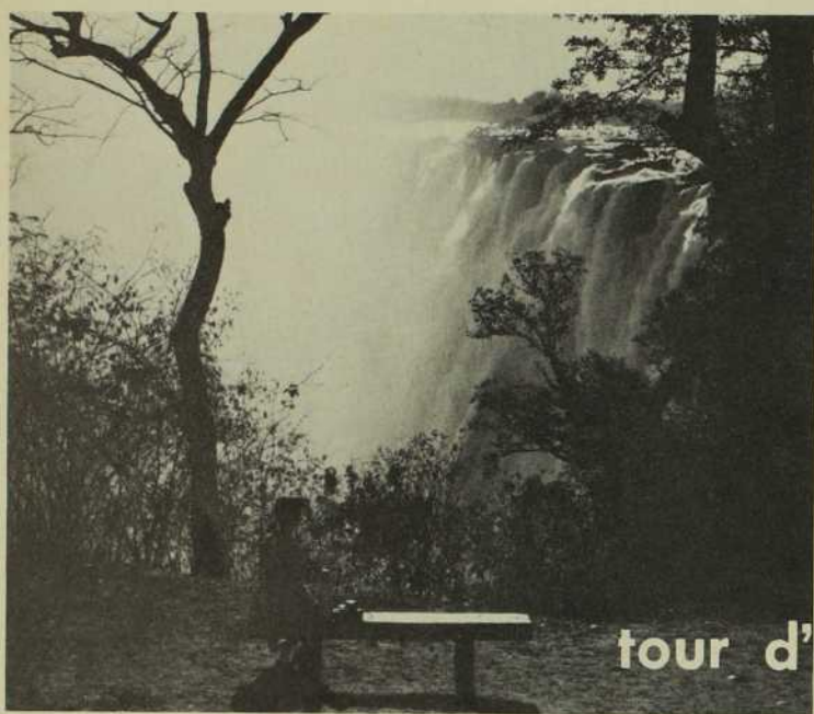
Les fameuses chutes Victoria et leur « mousseline de vapeur ».