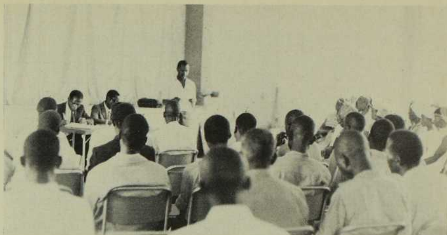
Réunion habituelle d'un conseil paroissial.