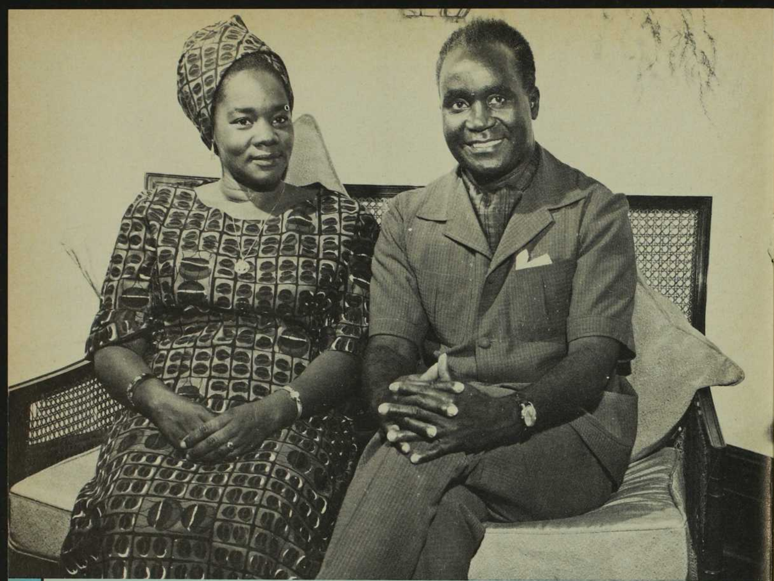
Le Président Kenneth D. Kaunda et sa charmante épouse, Betty.