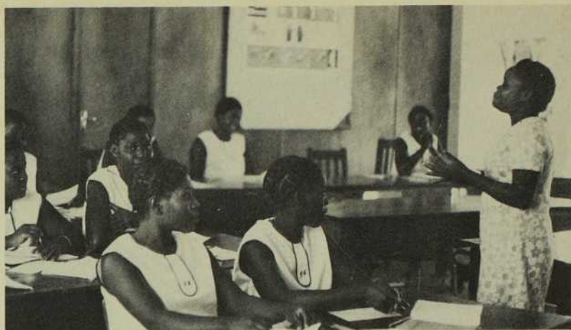
Un cours d'hygiène donné par un professeur autochtone.

Au sein de l'Église, la femme collabore toujours plus étroitement à son mouvement d'expansion. Son rôle dans les mouvements de l'Apostolat des Laïcs en est un de présence et d'animation. Il s'avère de plus en plus important et efficace. C'est prometteur pour l'avenir de l'Église locale qui, avec elle et par elle, assure à la communauté chrétienne un service diversifié, toujours plus ouvert à tous les besoins matériels et spirituels de la grande famille zambienne.