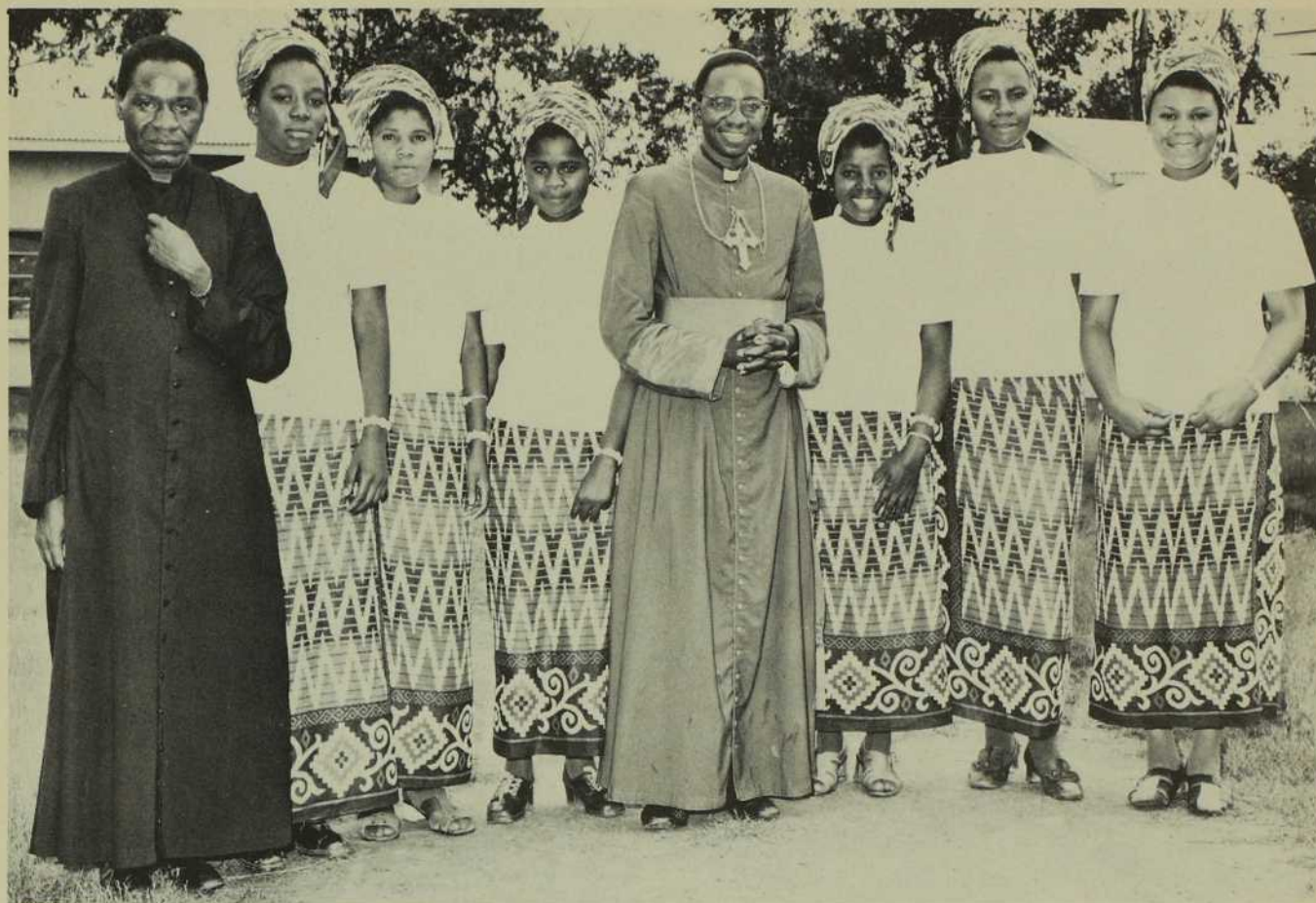
Mgr Milingo au milieu du premier groupe de postulantes des Filles du Sauveur.