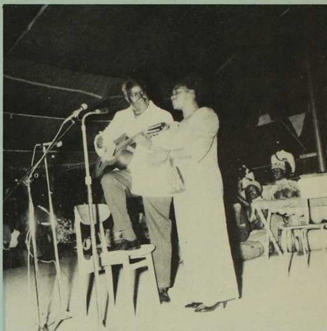
Le chant accompagné de la guitare: passe-temps favori du Président Kaunda.

Le président Kaunda avoue lui-même la bienfaitante influence exercée sur lui par les écrits de Mahatma Gandhi et sa politique de non-violence dans la lutte pour l'Indépendance des Indes. Les goûts simplifiés du président de la Zambie, où est banni l'usage des liqueurs alcooliques et même de la cigarette, l'apparentait déjà au grand « gréviste de la faim ». Dès les premières années de sa lutte pour la libération de son peuple, K.K. a mis de côté viande, thé et café.