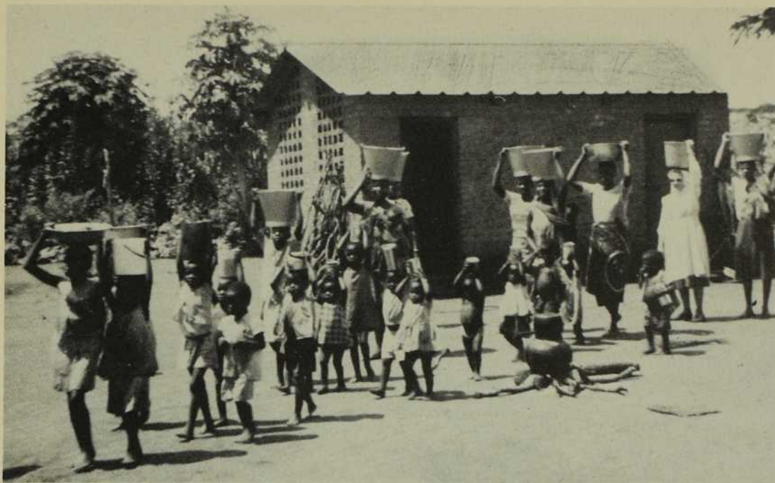
C'est l'heure d'aller chercher l'eau... Tous s'y prêtent joyeusement, même les petits!

s'échelonne sur une période de deux années complètes. Au programme sont inscrits des cours de Bible, de catéchèse, de liturgie, de morale. Certaines matières académiques de base y sont insérées. À la fin de la deuxième année, ces candidats subissent un examen. Si les résultats sont satisfaisants, ils sont publiquement acceptés lors d'une cérémonie officielle habituellement présidée par l'Évêque lui-même.