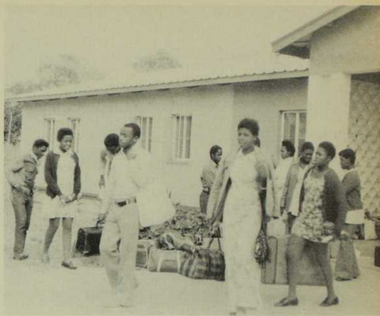
Les délégués se séparent à regret, plus convaincus que jamais de l'importance de leur rôle.

Tel fut le sujet qu'il développa d'une façon magistrale. En voici quelques passages-clés : « Puisque le mot d'ordre de la Jeunesse Étudiante Chrétienne est de conduire les jeunes au Christ et le Christ aux jeunes, tout ce que nous faisons doit être accompli en gardant cette pensée constamment présente en nous. Mais sommes-nous meilleurs que les autres que nous voulons influencer ? Nous accomplissons beaucoup d'activités sociales : aide aux nécessiteux, contribution à divers projets de développement, mais où est l'essentiel ? Notre agir ou le motif profond de cet agir ? Notre tâche serait combien plus facile si elle se limitait à solutionner des problèmes sociaux. Ce type d'engagement, à mon sens, est le plus facile. Il suppose le don de nos forces, de notre temps, de nos talents. Mais les non-chrétiens sont capables d'un tel engagement aussi bien que nous. Qu'est-ce qui différenciera notre action de la leur sinon le motif profond qui la sous-tend : conduire les jeunes au Christ. Si jusqu'ici notre influence s'est avérée insuffisamment convaincante, c'est peut-être que nous ne sommes pas assez chrétiens, authentiques disciples du Christ.