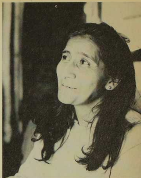
Cette femme vit dans un bidonville de la capitale. Son regard est quand même chargé d'espérance.

D'après documents préparés par CLAIRE GARCEAU et AGNÈS BOUCHARD, m.i.c.