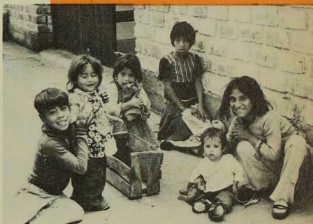
Dans les bidonvilles, les enfants ont la rue comme "espace vert"... Ils semblent heureux quand même!