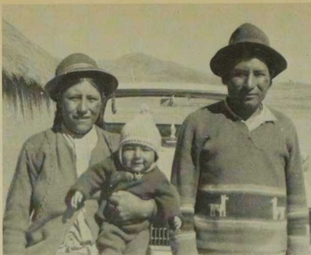
Une brave famille chrétienne du "campo".

En conclusion: le territoire géographique où nous travaillons est immense. Le climat rigoureux. Les moyens de communications pas faciles. Pourtant dans cette zone défavorisée, aride, peu productive, vivent des hommes, des femmes, des enfants. Ils ont des aspirations légitimes, des besoins élémentaires à combler; ils ont faim et soif de justice, de liberté, de Dieu. Leur situation de vie infra-humaine est une réalité bien concrète, tangible, douloureuse.