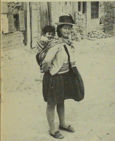
L'attrait de la grande ville a fait descendre cette brave paysanne de son paisible village de la Sierra. Elle habite un bidonville de la capitale.