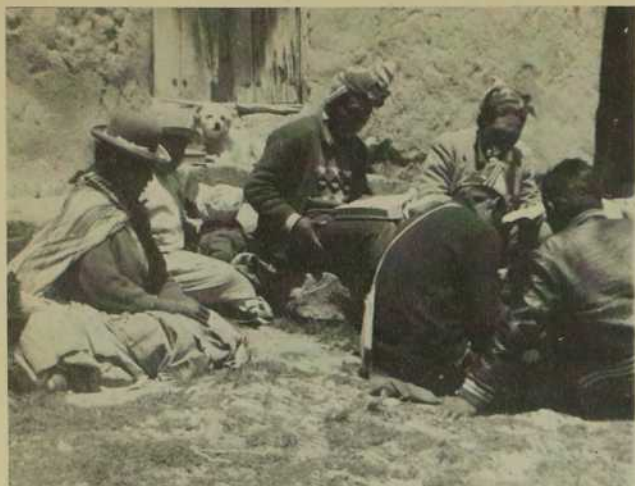
Des groupes de paysans des Andes aiment se réunir pour partager la Parole et vivre l'union des coeurs...

membres de diverses Associations Régionales de Catéchèse à l'occasion des réunions au niveau diocésain ou régional à (IRCEA) Institut Régional de Catéchèse et Évangélisation Andine de Cuzco.