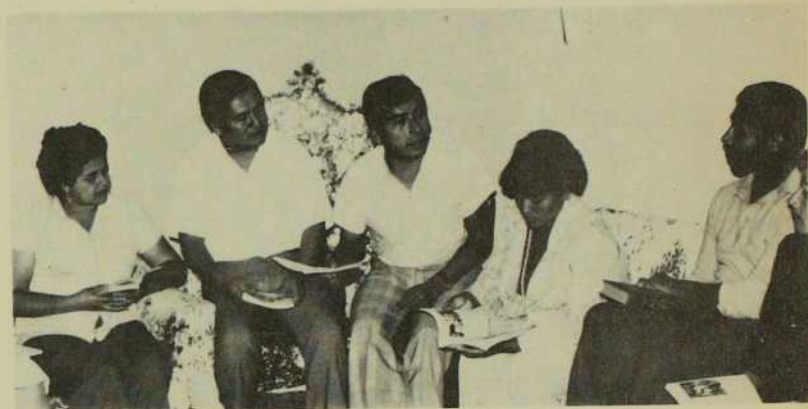
Le lundi soir, c'est la réunion des membres de cette communauté de base. On y travaille sérieusement...

R ECHERCHER ET TROUVER LE vrai visage du Christ, à travers des réalités sociales multiples et complexes, pour le faire connaître et aimer de ces hommes et de ces femmes avides des construire un Pérou chrétien: tel est le défi posé à l'Épiscopat péruvien actuel.