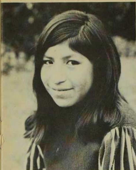
Native de la Sierra, cette jeune Indienne est venue à Lima chercher du travail. Proie facile pour les exploités...