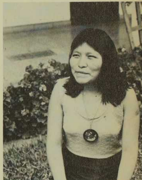
Une employée domestique de la tribu des "Campos" de la Selva amazonienne. Elle travaille à Lima.