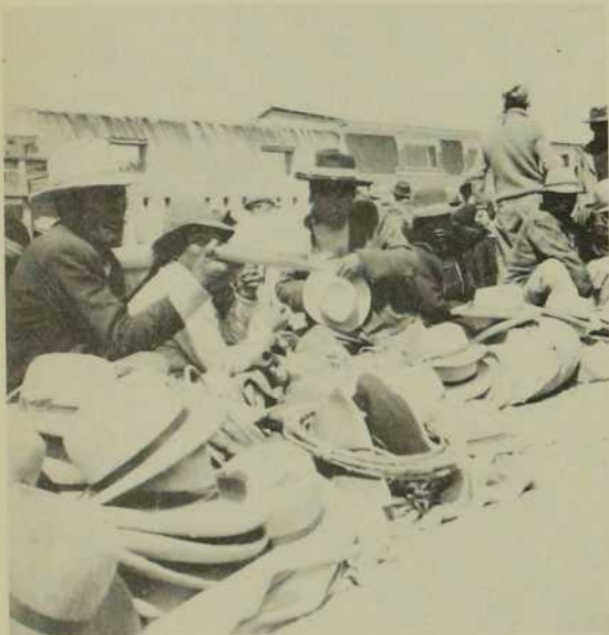
L'industrie de la confection des chapeaux: un autre gagne-pain pour la population indigène.