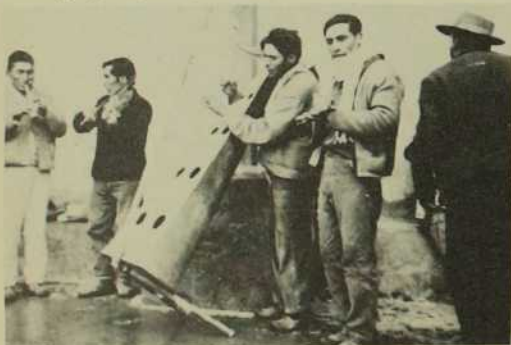
Et on se fabrique des instruments de musique comme excellent moyen de divertissement.