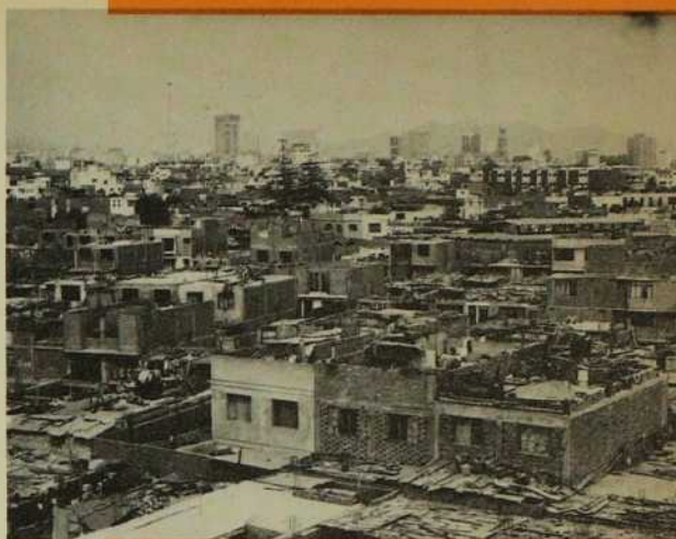
Vue à vol d'oiseau d'un bidonville au centre de Lima.

Les titres et sous-titres sont de nous. N.D.L.R.