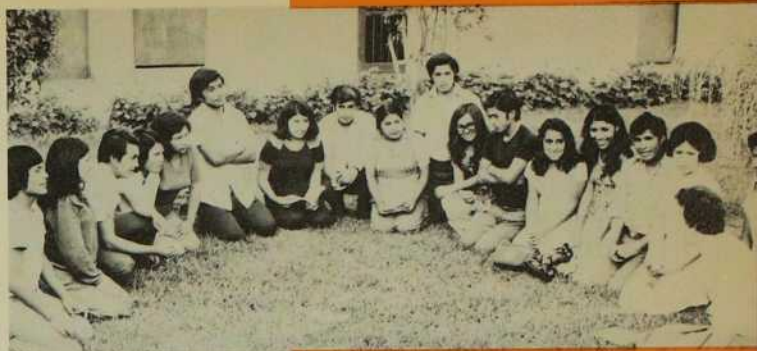
Jeunes ouvriers et ouvrières de Lima en réunion d'étude. Ils sont l'espérance de l'avenir...

L FAUT D'ABORD SOULIGNER le fait que nous sommes présentes dans les trois régions géographiques du Pérou: la Côte, la Sierra, la Selva. Nous apportons notre collaboration, dans différents secteurs d'activités et selon les orientations de nos Évêques, à des expériences concrètes à l'intérieur d'une pastorale de plus en plus intégrée et articulée.