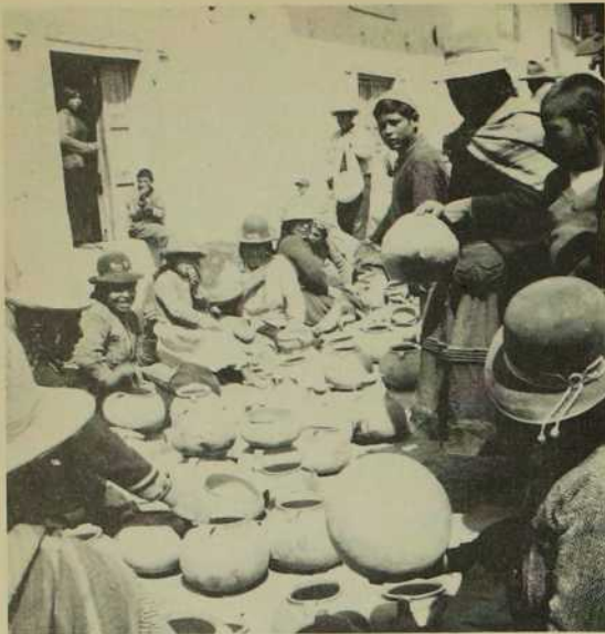
Les paysans Andins sont d'habiles potiers et... ils savent travailler dans la joie!