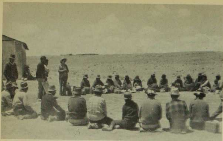
Dans les Andes péruviennes, la florissante communauté de base de Mollocahua.

En 1972, l'Archidiocèse enregistre une nouvelle expérience. Il s'agit cette fois de la mise en action d'un programme particulier en vue de la formation d'agents de pastorale. Ce programme est conçu dans le but précis de promouvoir un laïcat bien formé et fortement engagé comme animateurs de communautés chrétiennes.