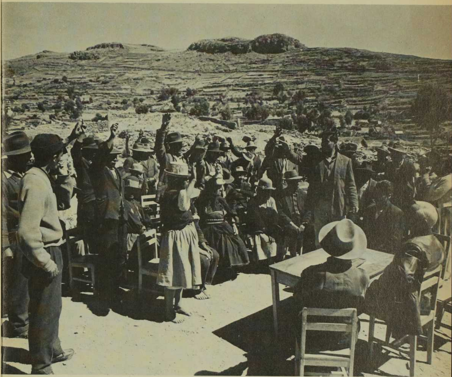
Rassemblement de paysans des Andes péruviennes. Ils votent à main levée en vue d'un projet de développement communautaire.