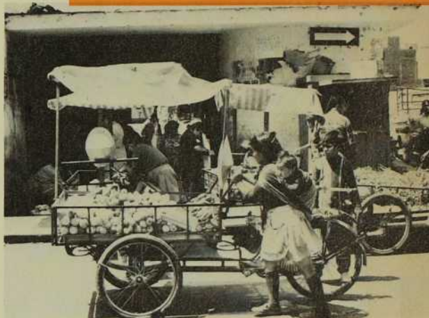
Une vendeuse ambulante. Le père de famille est sans emploi; la maman, bébé sur le dos, tente sa chance de gagner le pain de chaque jour.