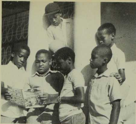
Susciter l'engagement chrétien dans le coeur de cette belle jeunesse haïtienne: un des objectifs prioritaires des M.I.C. en Haïti.