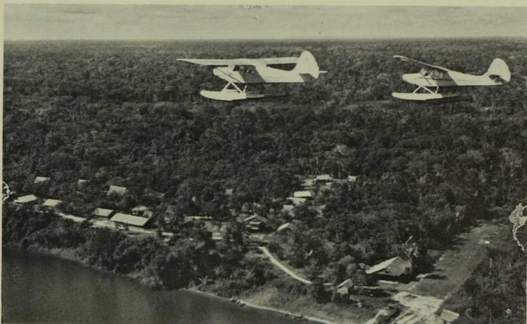
Vue à vol d'oiseau de la Selva péruvienne. C'est au coeur de cette jungle que trois MIC commenceront leur oeuvre d'apostolat au Pérou en 1960.

C'est d'un quadrimoteur étouffant et surchargé, qu'en la nuit du 21 au 22 janvier 1960, trois M.I.C. descendent pour la première fois en terre péruvienne. Ce pays singulier et fascinant compte trois régions naturelles très tranchées: la Costa, la Sierra et la Selva représentant trois mondes entièrement différents, tant au point de vue géographique que climatique et humain. Avec les années, les M.I.C. s'inséreront dans chacune de ces régions, en commençant par la plus mystérieuse et la plus étendue, cette jungle touffue et humide qu'est la Selva.