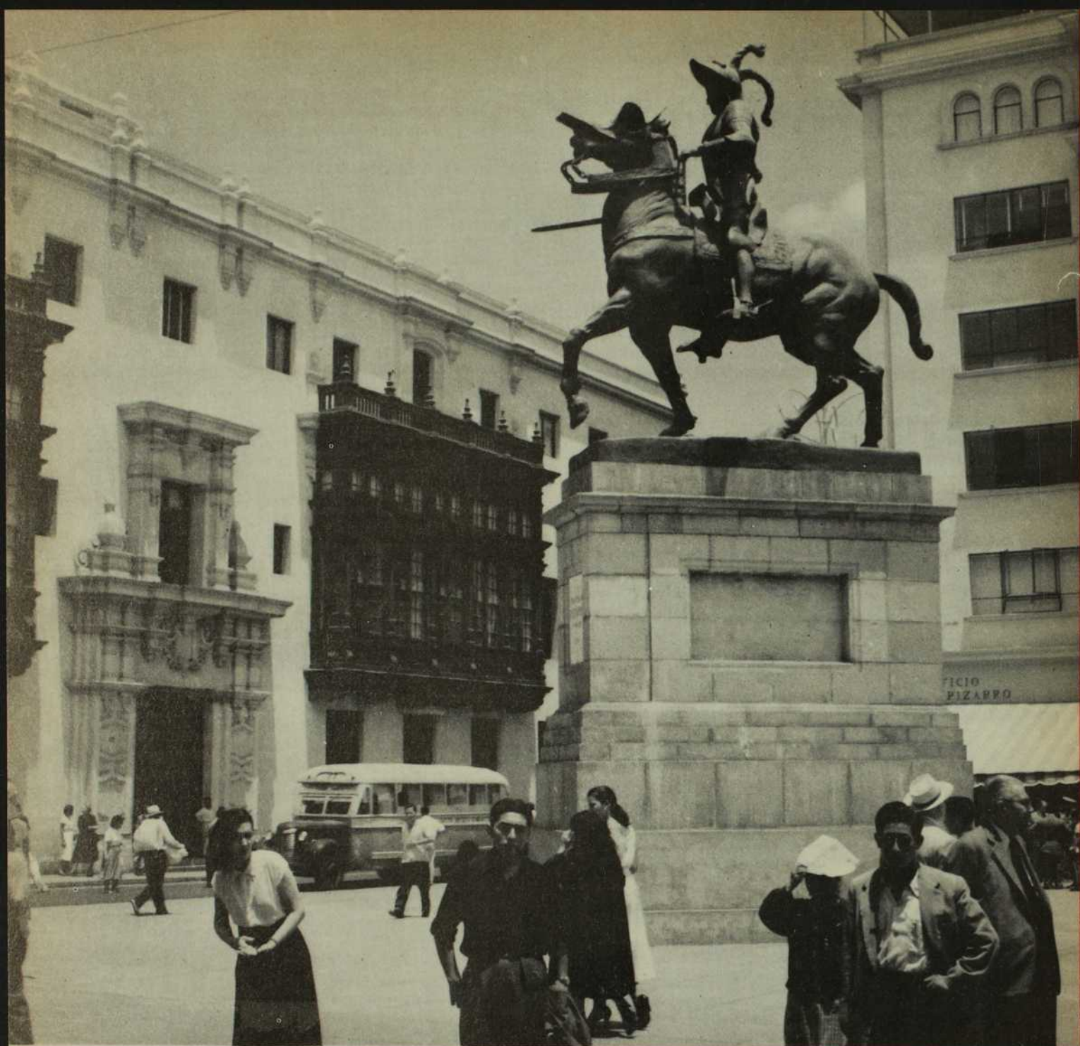
Nous sommes ici au cœur de la grande et belle capitale péruvienne, Lima. Cette magnifique statue équestre fut érigée en l'honneur de Francisco Pizarro, conquérant de l'Empire Inca au Pérou. (Photo: Canadian Pacific Railway).