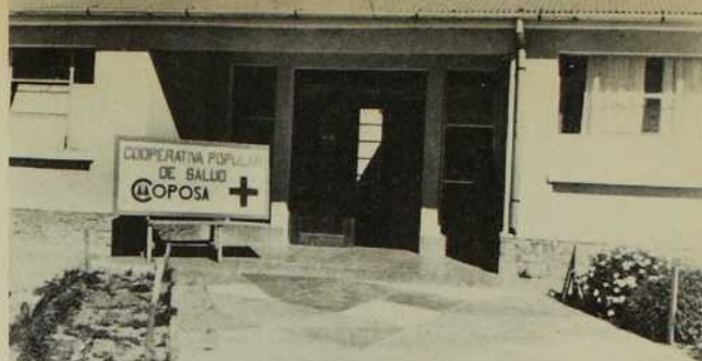
L'Hôpital COPOSA de Llallagua. Les Boliviens en sont fiers et les MIC aussi...

Ne pouvant réaliser leur projet de collaboration à