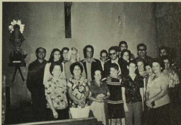
Groupe de chrétiens engagés. Ils se sont réunis autour de Notre-Dame-de-la-Caridad pour prier ensemble.