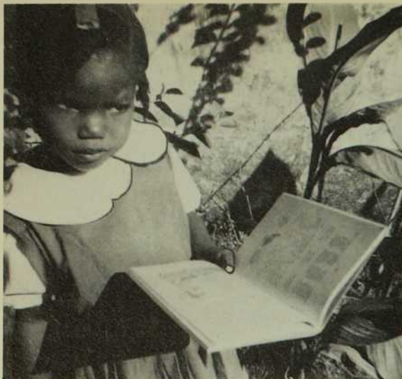
Charmante cette petite! Grâce à l'effort concerté des responsables de l'éducation, les enfants haïtiens peuvent apprendre à lire dans leur langue savoureuse: le créole.

À travers l'enseignement traditionnel perçue, chez les M.I.C., une volonté tenace d'aller sans cesse de l'avant. Sous l'impulsion de Vatican II, nous enregistrons une conversion des mentalités, un cheminement progressif de nos méthodes d'insertion et d'évangélisation avec, comme conséquence, une action d'ensemble plus en profondeur. Et c'est l'apport combien prometteur de nos Soeurs Haïtiennes nous facilitant une meilleure intégration et nous enrichissant de leurs valeurs humaines et culturelles propres.