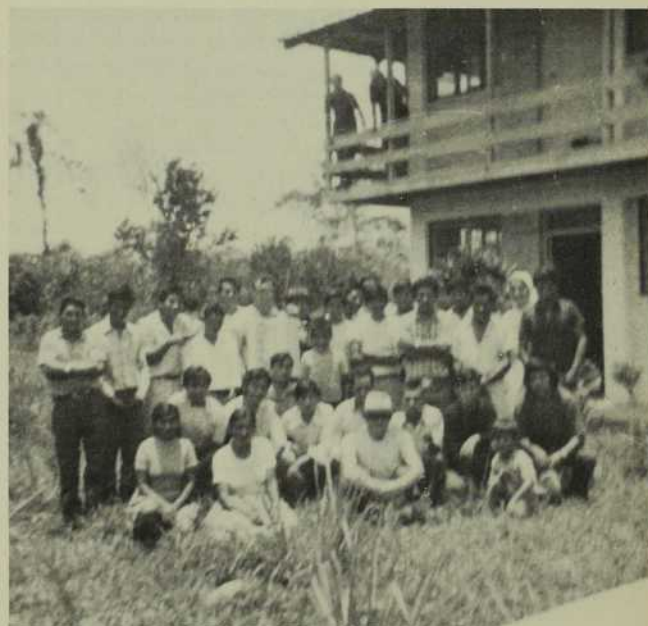
Le Père Curé de Villa Tunari, heureux de nous présenter son groupe de catéchètes ruraux. Ils sont des collaborateurs merveilleux, paraît-il...