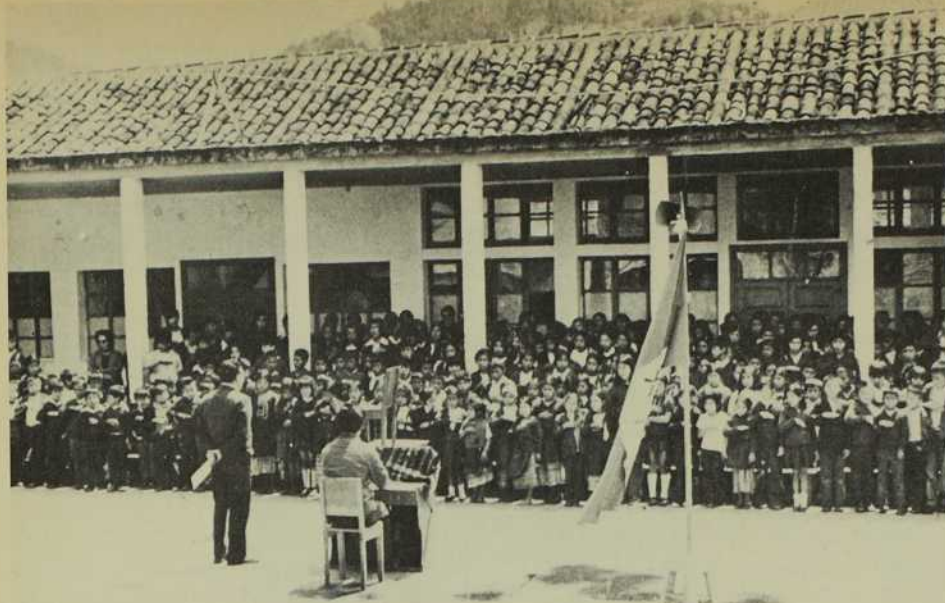
L'école Pedro de Béthancourt et sa remuante clientèle scolaire. Ils sont maintenant 475 et 11 des professeurs sont d'anciens élèves. La relève s'annonce bien...

oeuvre pour répondre à tous les besoins de cette jeunesse montante. Progressivement s'organisent des cours de chant, de musique instrumentale, de catéchèse, d'orientation professionnelle.