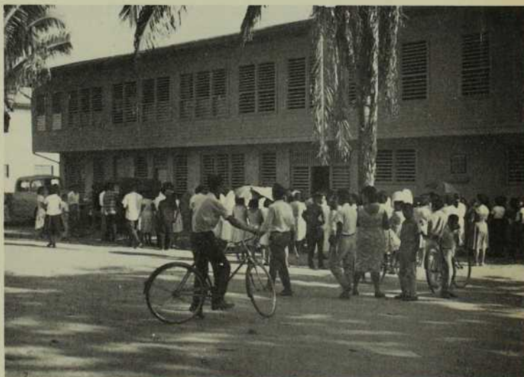
C'est grande liesse à Pucallpa en ce 2 septembre 1962. On vient en foule assister à la bénédiction de l'internat MIC récemment construit.

Sans tarder les M.I.C. sont à l'oeuvre. Rencontres d'architectes et de contracteurs se multiplient. Bientôt l'école est en voie de construction. Dès le 1er avril 1963, la première école de religieuses dans le secteur Breña accueille 300 fillettes des alentours. Les mensualités plus que modiques permettent aux familles les moins fortunées d'y inscrire leurs enfants. En contrepartie, la directrice doit multiplier les démarches pour trouver les ressources indispensables au fonctionnement de ce modeste établissement scolaire. La Municipalité de Breña et le Ministère de l'Éducation accordent quelques subventions. Les parents des élèves, malgré leurs revenus limités, collaborent aussi avec un intérêt soutenu pour résoudre les problèmes im-