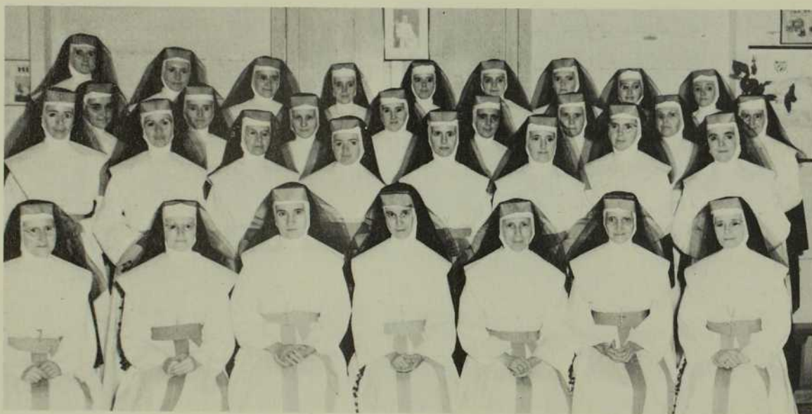
1952. Une réunion fraternelle groupe 32 MIC à Manguito au diocèse de Matanzas. C'était le "bon temps" il y avait tant de bonheur à proclamer librement la Bonne Nouvelle du Salut.

"Les mots me manquent pour vous exprimer ma reconnaissance... J'ai toujours désiré pouvoir compter, dans mon diocèse, sur une communauté comme la vôtre... je veux dire, des Religieuses qui ne se feraient pas scrupule de sortir de leur couvent pour porter la connaissance de Dieu là où ce serait le plus nécessaire... J'attends beaucoup des Religieuses canadiennes."