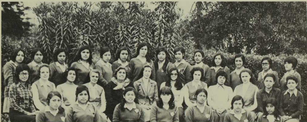
Les MIC fières de nous présenter leurs grandes élèves du Secondaire V; après 15 ans... les arbres ont grandi comme les enfants.

Ce sont là d'humbles semences. La moisson germera en son temps, nous en sommes convaincues. Peu importe que la saison des fruits soit hâtive ou tardive. L'important est de semer à tous vents le grain précieux de la Bonne Nouvelle. Une chose est certaine: le Royaume avance... et cela seul est essentiel!