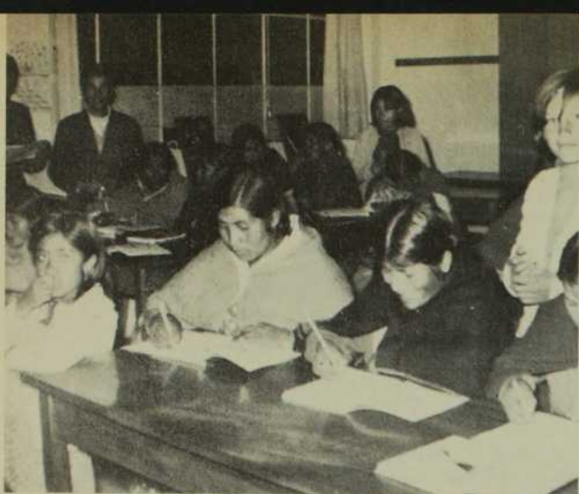
Un cours d'alphabétisation aux braves femmes Indiennes de La Paz.