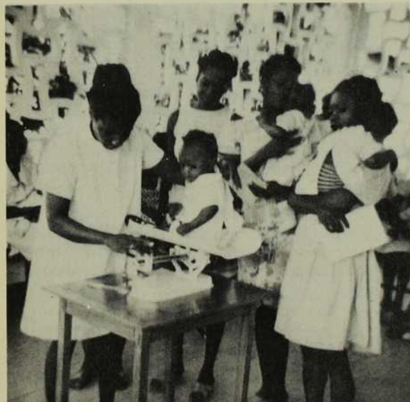
Au Centre Materno-infantile de la clinique St-Jean du Limbé. Que de petits êtres fragiles ont la vie sauve grâce à cette courageuse initiative M.I.C.!

En outre, le centre materno-infantile (0-5 ans) reçoit mamans et enfants pour des instructions concernant l'hygiène familiale. La santé de l'enfant est également contrôlée: poids, développement physique et mental. Les vaccins contre les maladies contagieuses lui sont aussi donnés progressivement. La distribution de vitamines A pour combattre la cécité avitaminique est en circulation dans certaines régions.