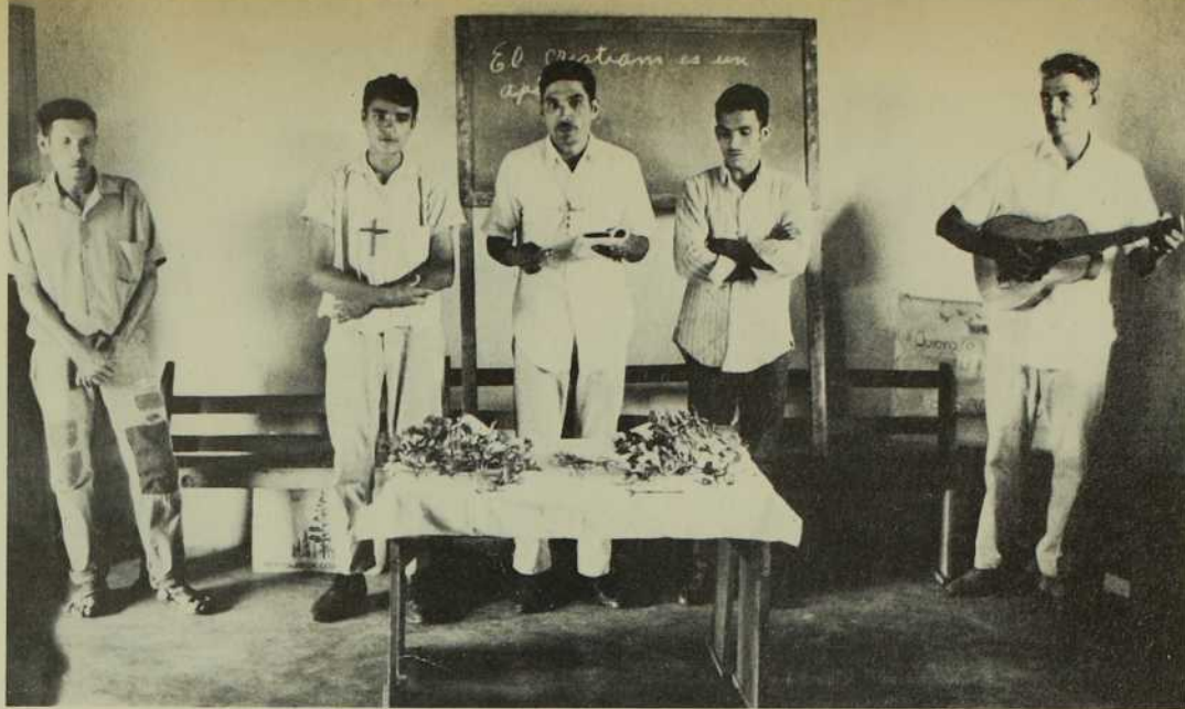
Un groupe de "Délégués de la Parole". Au centre, le président de l'Assemblée entouré de son équipe: le commentateur, le lecteur, le guitariste, le sacristain. C'est une merveilleuse équipe et quel engagement sérieux!