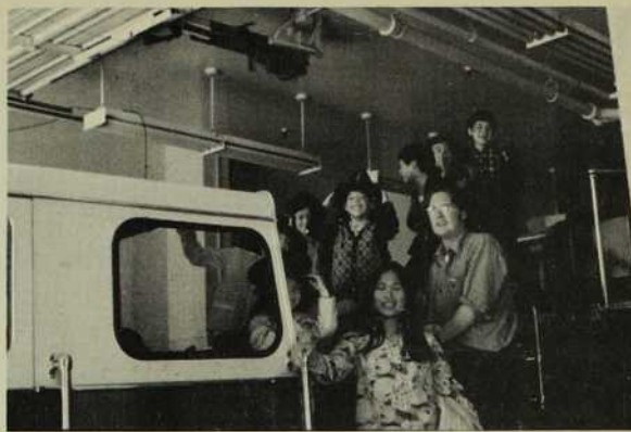
Des enfants de "SMILE" en excursion chez les pompiers.

la mission, me demanda en avril '74 de prendre un poste de codirection du camp de vacances pour les 6-12 ans. Laissant tomber l'idée de poursuivre des cours d'été, dès la mi-mai je m'engageai avec des jeunes adultes à chercher des méthodes d'approche qui pourraient attirer et intéresser encore plus les enfants du milieu.