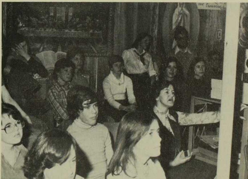
... "Ma petite expérience missionnaire qui, je crois, s'agrandit chaque fois que je la partage."