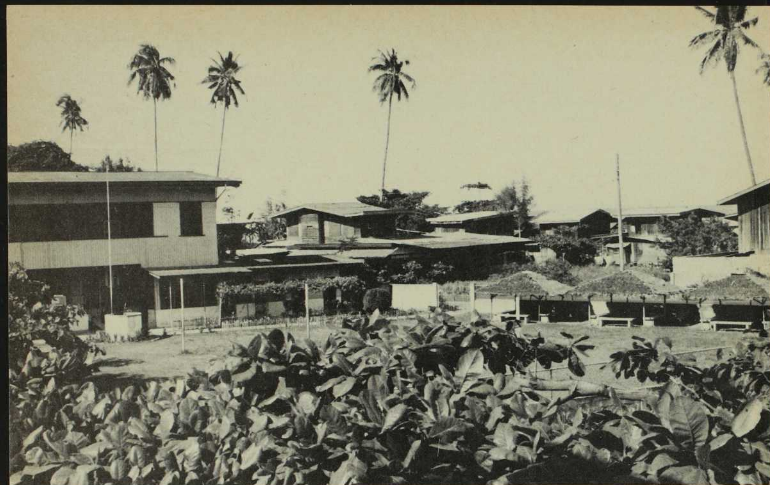
La végétation tropicale est très belle à Malita. Au loin, derrière les maisons et les cocotiers, c'est l'immense océan Pacifique.

De Malita, en 1977, l'abbé Generoso Camiña, aujourd'hui évêque du nouveau diocèse de Digos, s'était rendu dans la montagne auprès des Tagakaulos. Bientôt rappelé à Davao, il fut remplacé par l'abbé Gilles Bélanger qui continua et développa l'oeuvre commencée, apprit le kaulo et le manobo, et parcourut à pied tous les recoins de cet immense territoire.