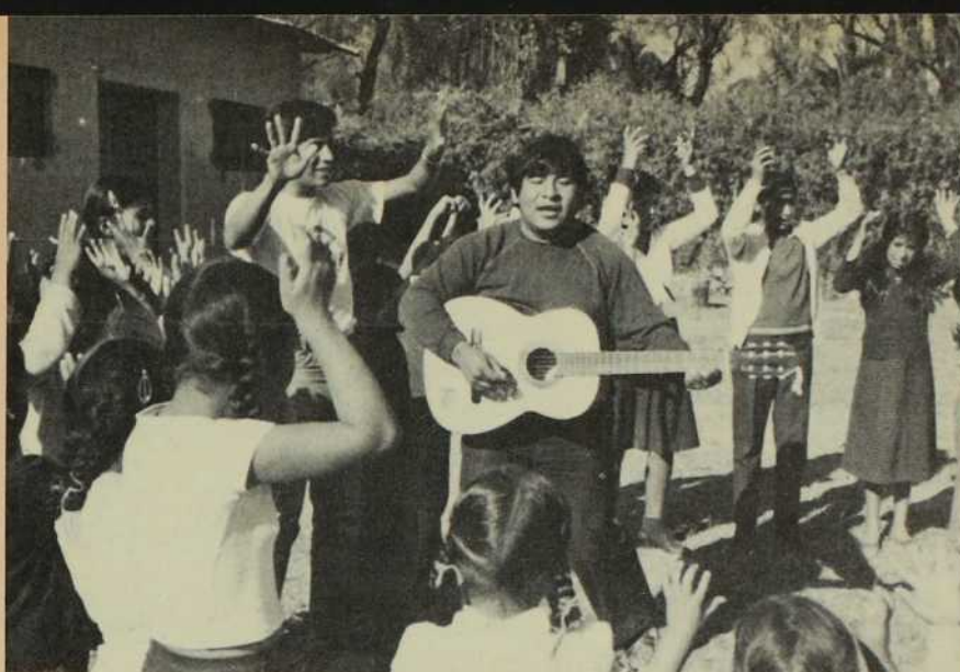
"Je suis très encouragée du succès obtenu par les deux séminaristes dans l'animation catéchétique." Les chants mimés font partie du programme.

Une seconde invitation, venant cette fois du Directeur de Radio San Rafael, nous amena à faire d'Amisol une nouvelle vedette de radio. Amisol a déjà son