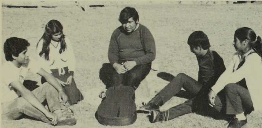
Un séminariste bolivien engagé dans une activité pastorale avec des jeunes.

Le monde de demain est en puissance dans le cœur des enfants. Si dès leurs premières années ils apprennent l'amour universel, sans frontières, et la joie du don, si l'espérance fait son nid en leur vie, alors demain sera plus fraternel, plus humain et ainsi plus divin. Dans la simplicité d'un regard d'enfant, se lève déjà l'aurore d'un demain le meilleur possible.