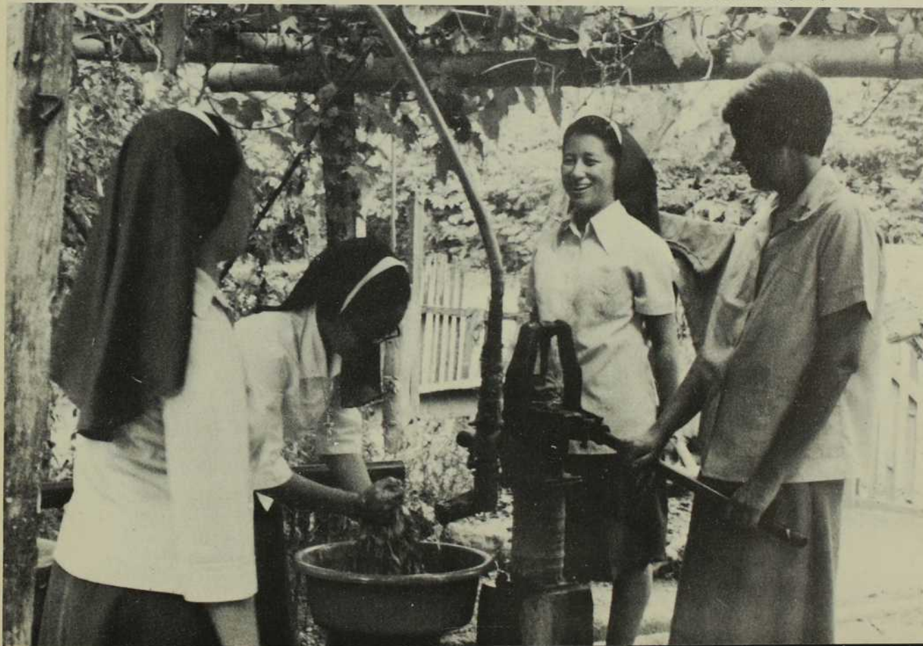
S. Elizabeth rince sa lessive au puits de la cour. Ses compagnes fournissent l'eau en actionnant la pompe.

N.D.L.R. — Des remerciements sincères s'adressent à la Société des Missions Étrangères pour sa contribution à cet article, en particulier à l'abbé Pierre Fisette qui a accordé une interview et à son confrère de Malita, l'abbé Georges Fortin pour le prêt de ses excellentes photos.