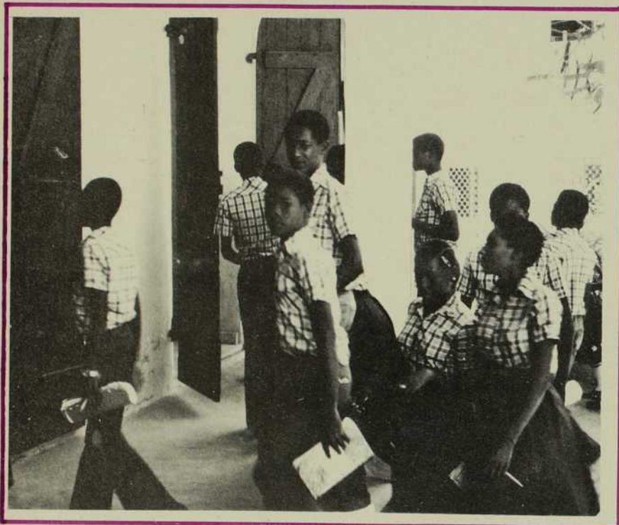
De jeunes étudiants se rendent à l'école de catéchèse.

ou moins soignée dans des collègues. Les écoles publiques fonctionnent mal faute de matériel nécessaire, d'autre part elles sont insuffisantes pour recevoir les jeunes avides de savoir. Ceux qui ont le privilège de fréquenter une de ces écoles s'efforceront corps et âme d'arriver en rhétorique. Parfois ils viennent des coins les plus reculés du pays, laissant parents et amis pour entrer en ville continuer leurs études. Mal nourris, mal logés, ces jeunes se saignent pour atteindre la terminale.