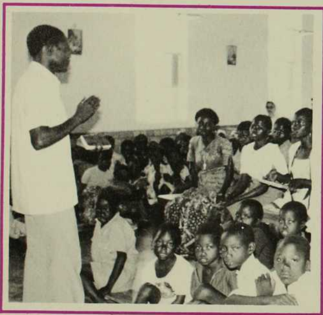
«Si le Christ venait en Zambie, il se ferait prédicateur de la Bonne Nouvelle.»

Comme fruit d'un long discernement les jeunes ont choisi un thème: La LUMIÈRE et une devise: Le CHRIST EST NOTRE LUMIÈRE, ENSEMBLE SOYONS PORTEURS DE LUMIÈRE. Ils ont aussi composé un chant: LET US SHINE NOW. (Brillons dès maintenant). Le macaron adopté pour la fête représentait une lampe allumée entourée d'étoiles