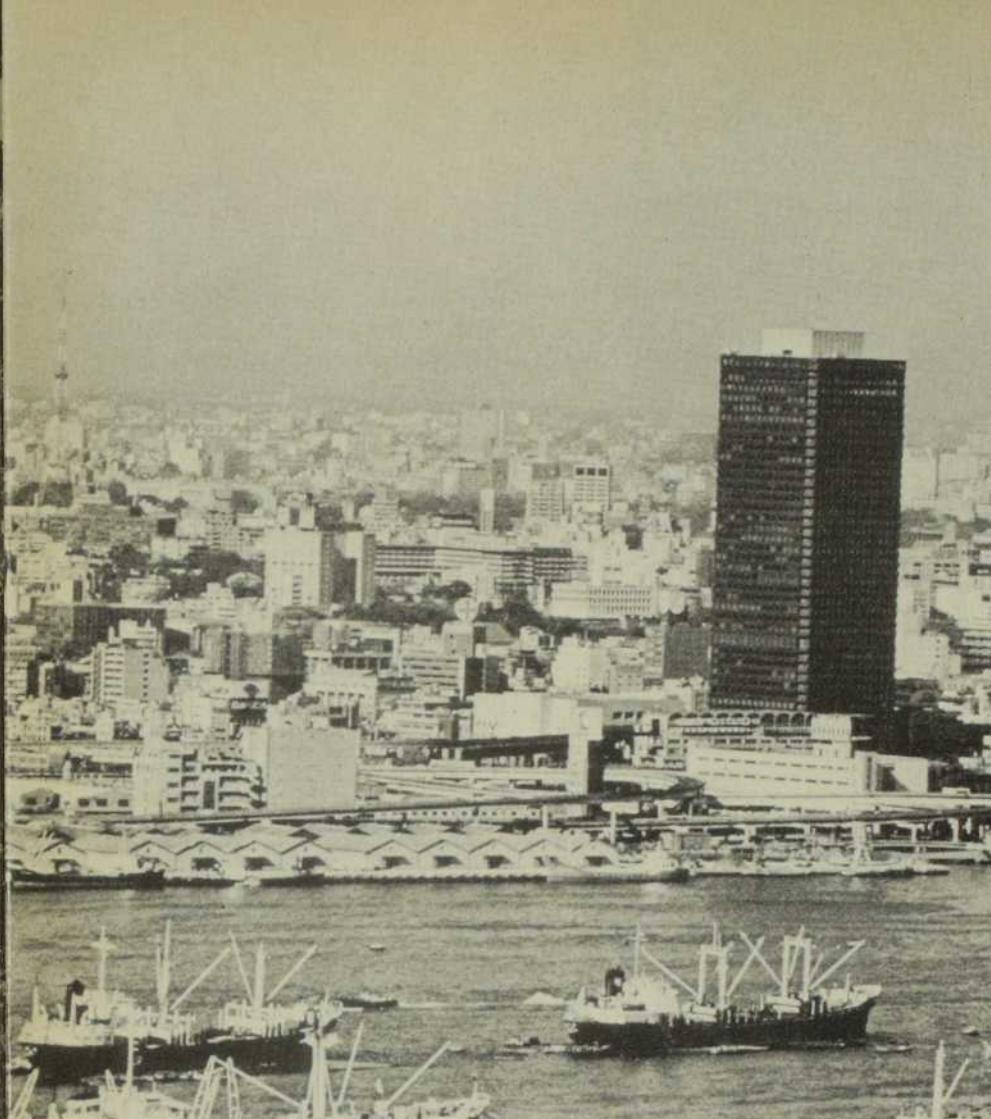
L'horizon de la gigantesque métropole de Tokyo (11 millions d'habitants) change rapidement avec l'apparition de gratte-ciel de plus en plus nombreux. Vus de la baie de Tokyo, on aperçoit de gauche à droite, le Keio Plaza, 170 mètres de hauteur, la Tour de Tokyo, 333 mètres et le Centre mondial du commerce, 152 mètres.