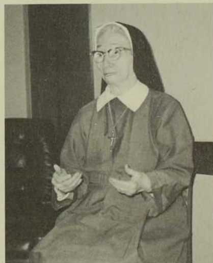
«J'ai souvent tremblé d'inquiétude pour nos chères enfants».

Quand, pour une des raisons invoquées plus haut, les parents se voyaient obligés d'éloigner un enfant de la maison familiale, le serviteur, la servante ou encore un mendiant était chargé d'aller porter le poupon à une crèche de la ville ou à notre refuge. Ces derniers n'étaient pas toujours fidèles à faire les 5, 10 ou 20 milles de chemin, à pied, pour se rendre à l'endroit indiqué et en revenir. Alors ils laissaient le bébé à son sort, sur le bord des rizières ou des petits sentiers. C'est justement pour que le commissionnaire se rende jus-