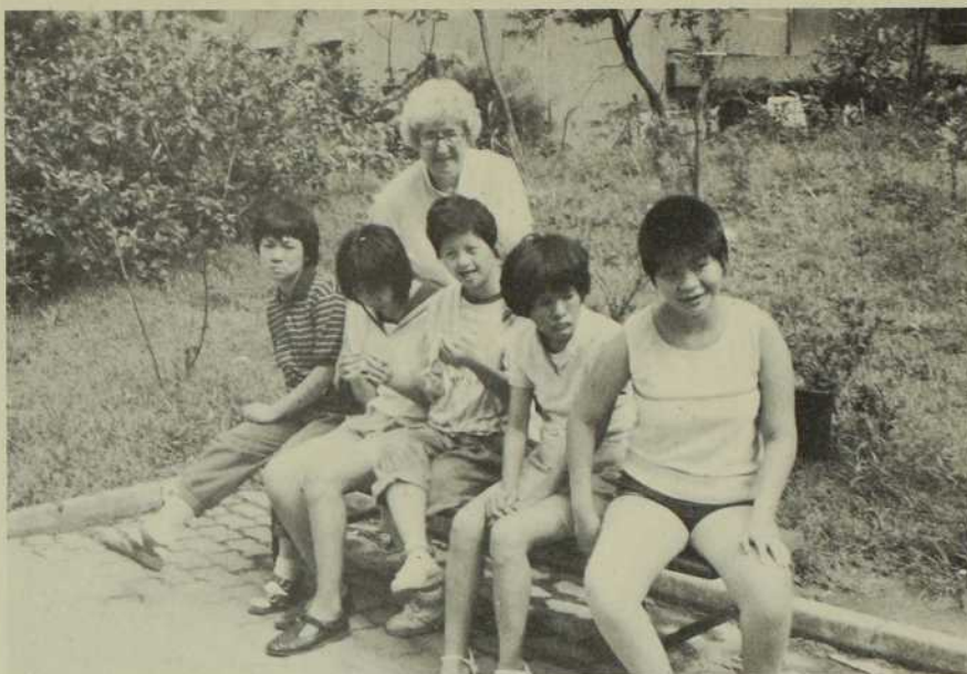
...quand j'ai commencé, j'avais un peu peur...