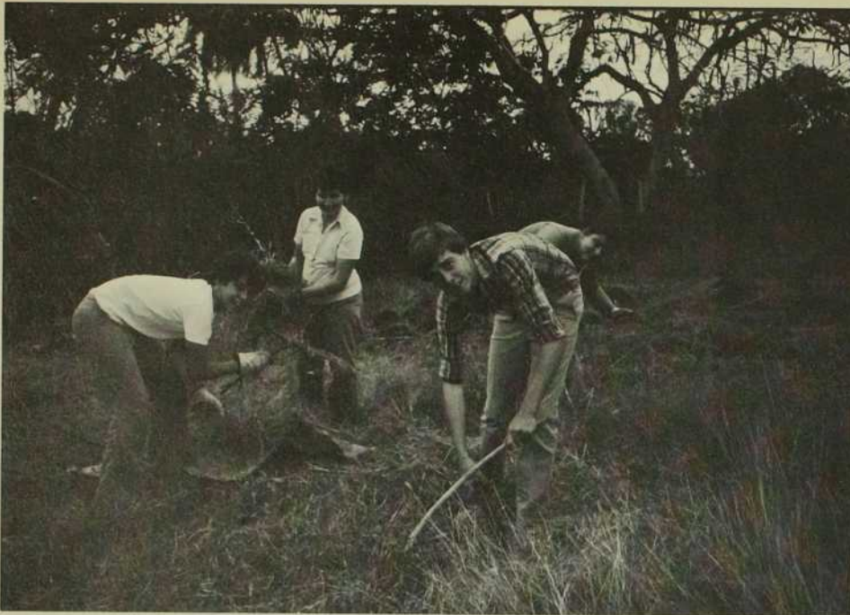
Tous les jeunes Cubains ont expérimenté le dur travail agricole.

Un brouillon de poème, révélateur comme un cri, m'est parvenu à travers un ami. Il est d'un jeune universitaire athée, plus ou moins secrètement pacifiste.