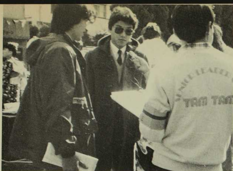
Pour ces jeunes, ce qui importe, c'est de participer.

Par mon groupe universitaire, j'entrai en contact avec l'organisation politique. Me voici donc impliqué personnellement dans les élections. Ce fut une expérience intéressante. Les chrétiens n'étaient pas entièrement d'accord avec mon option parce que notre action devenait trop politique.