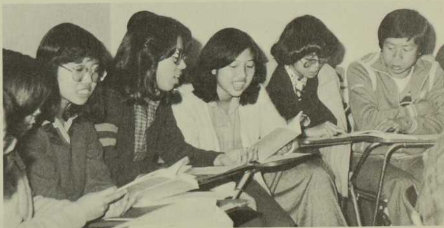
De retour à Hong Kong, ces jeunes chrétiens se rassemblent à nouveau.

Je me considère privilégiée d'avoir cette occasion pour être plus près d'eux. Si vous gagnez la confiance de la jeunesse, vous serez surpris par leur franchise et la confiance qu'elle vous donne. J'ai toujours aimé la jeunesse et je dois avouer que ma vie a été enrichie par «ce groupe de jeunes» qui m'ont révélé leur sincérité, leur amitié et leur courage pour être eux-mêmes. Ils n'ont pas peur d'admettre leurs erreurs - confiants qu'ils seront compris et acceptés comme ils sont. La jeunesse d'aujourd'hui a besoin de nous comme compagnons de route, pour être leurs amis dans les moments de joie et de peine. Elle a besoin de notre appui et non de nos leçons. Elle a besoin de notre amour et non de nos jugements. Elle a besoin de notre prière et de notre présence de foi pour les aider à garder «le feu sacré brûlant, à l'alimenter avec de l'amour». Keep the fire burning kindle it with love! ▲