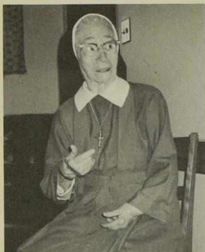
«Les Chinois ont toujours chéri leurs enfants».

Au début du siècle, plusieurs pays connaissaient des coutumes qui nous surprenaient. L'action des bons ou des mauvais esprits expliquait en partie le sort réservé aux vieillards et aux enfants malades ou infirmes. Les Chinois de cette époque n'étaient pas exempts de ces superstitions. Les jeunes enfants en étaient trop souvent les malheureuses victimes.