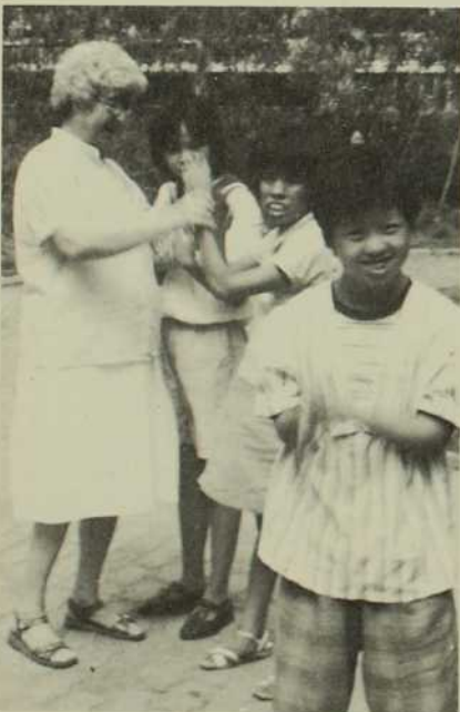
...Communiquer, c'est parfois difficile

Colette - Il s'agit d'une qualité de présence, si je comprends bien.