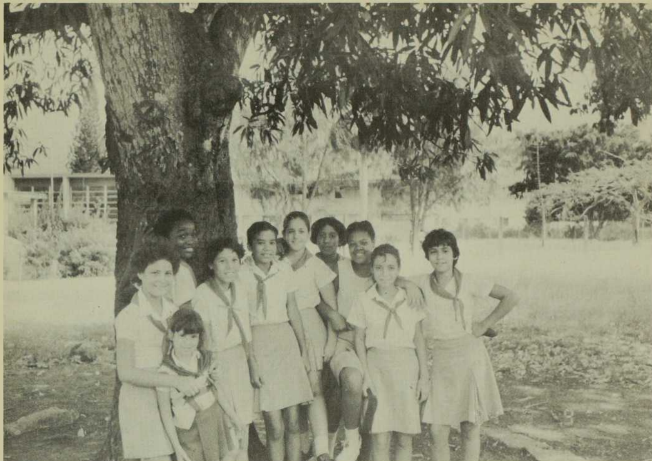
Jeunes étudiants cubains qui fréquentent le collège de Colon à Cuba.