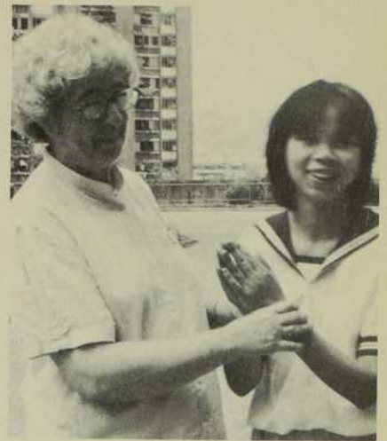
«Pour moi, l'essentiel, c'est être avec».

Louise - Oui. Au début, elle ne répondait pas mais maintenant je la surprends à dire plusieurs phrases. La Directrice du centre a été très touchée par le progrès de cette jeune fille. Un peu plus tard, elle a attiré mon attention sur un jeune homme qui se couvrait tout le temps la figure avec