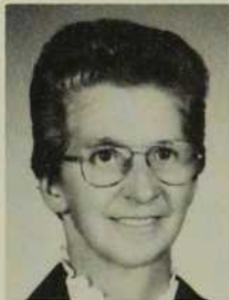
Jeanne d'Arc Fontaine St-Isidore de Dorchester Dioc. Québec Haïti