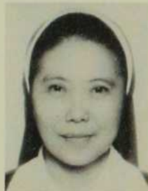
Socorro Gumnad Phillippines Pérou