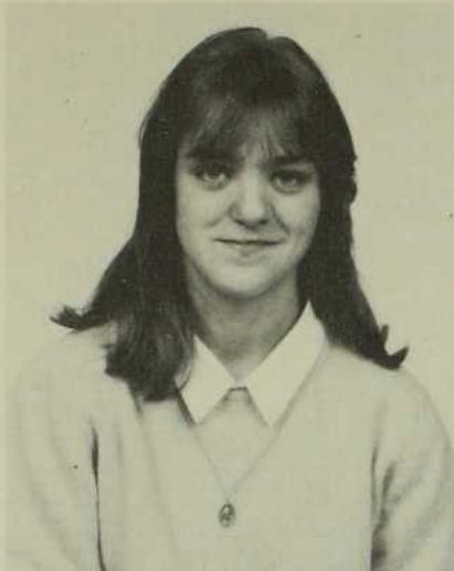
France Ricard invite les jeunes à participer aux camps R.A.M.P.E.

Dès le premier camp, j'ai trouvé l'accueil si chaleureux que je me suis inscrite pour les deux autres. J'ai trouvé l'expérience enrichissante. Après chacun je me suis sentie tellement bien dans mon cœur et dans ma tête! Quelque chose a «cliqué» tout de suite en moi et j'ai vu clair. J'ai trouvé des réponses à mes interrogations en me découvrant intérieurement et