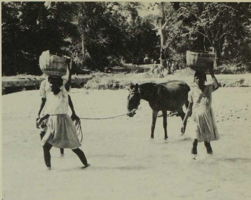
Préparons-nous au pire!