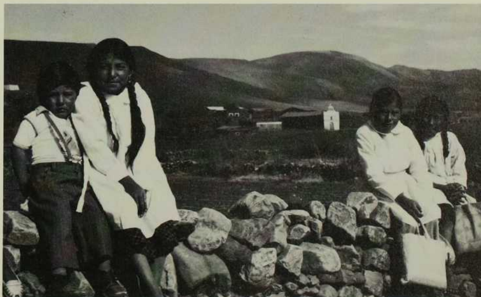
Une pause (et une pose!) avant de se rendre à l'école du village.

En tenant compte d'une expérience antérieure, on veut poser le toit avant la saison des pluies. Les briques, faites de terre et d'eau, ne sont pas cuites mais simplement séchées au soleil. Exposées à la pluie