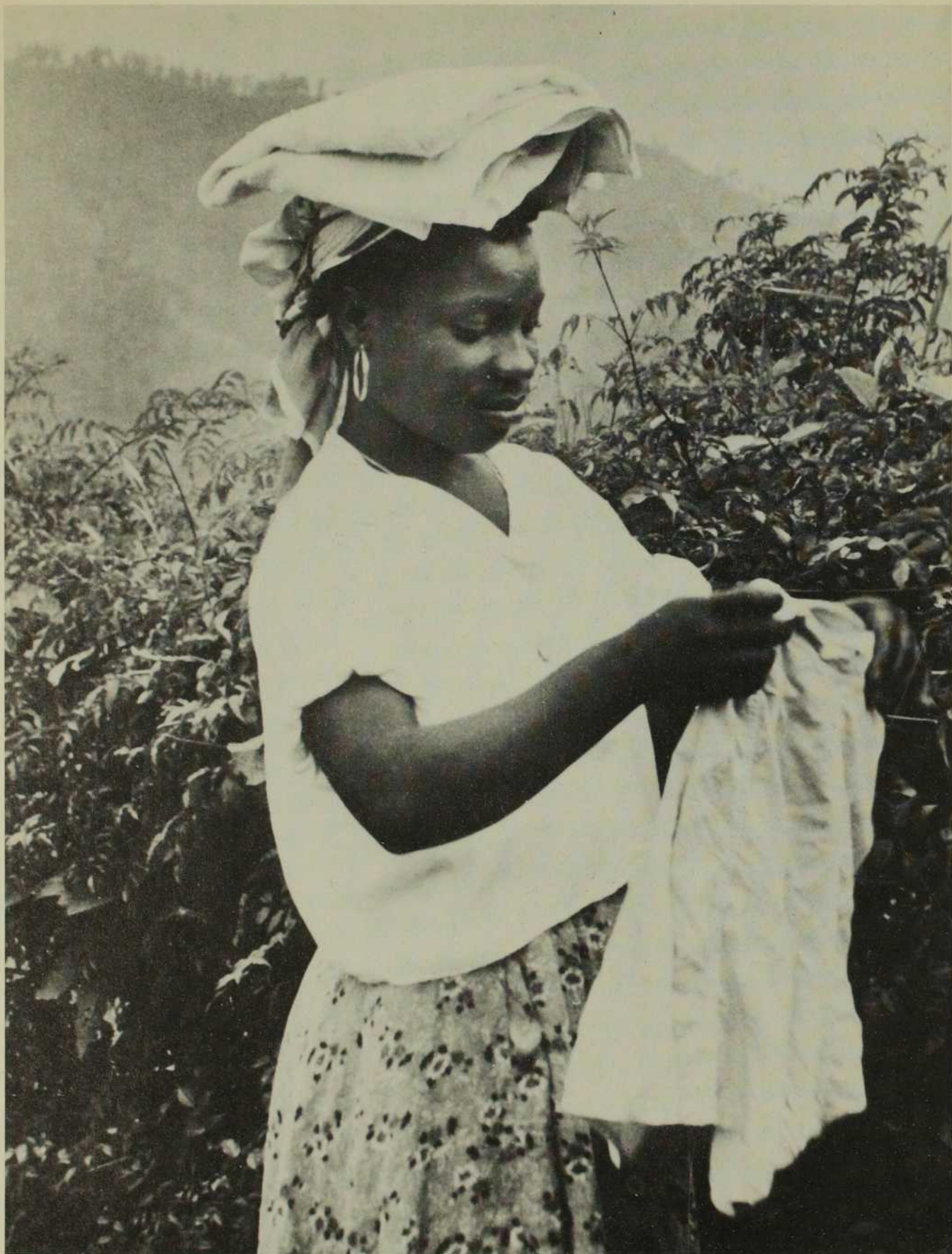
Après l'inondation, on n'en finit plus de faire sécher...