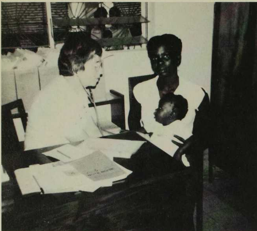
Dans ce dispensaire, tables, chaises, armoires, bureaux ont été renversés pêle-mêle dans la boue à travers le contenu des tiroirs de fiches et des étagères de médicaments.

l'eau ne les atteint pas. Puis l'eau monte, monte jusque par-dessus lits, matelats, bureaux, etc.