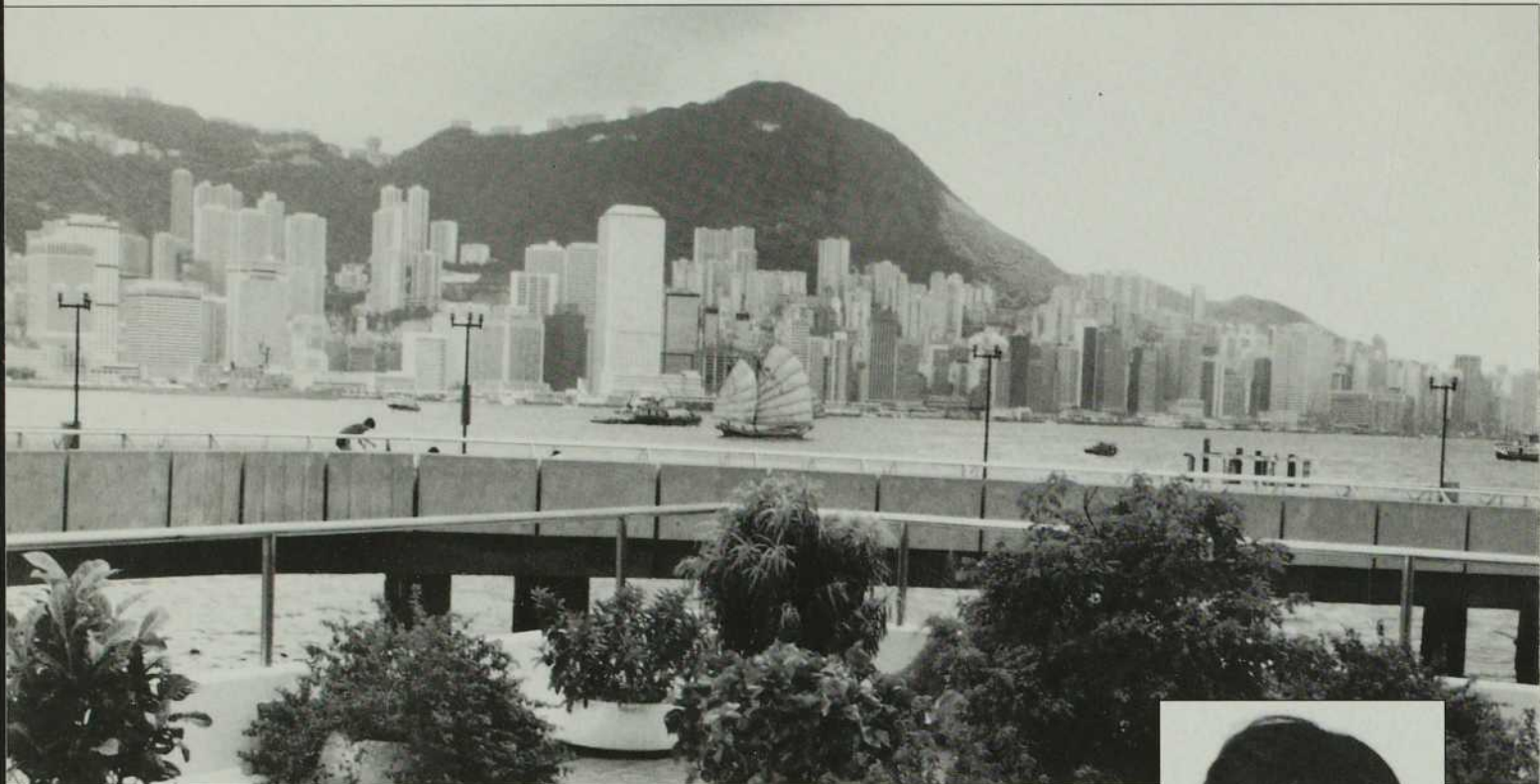
Vue de Hong Kong