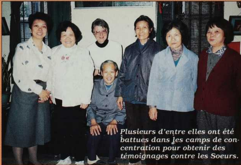
Plusieurs d'entre elles ont été battues dans les camps de concentration pour obtenir des témoignages contre les Soeurs.