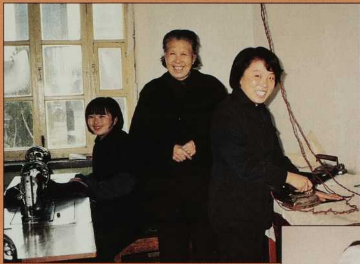
◀ À Szepingkai, les Soeurs Notre-Dame du Rosaire ont ouvert une boutique de confection pour assurer leur gagne-pain.