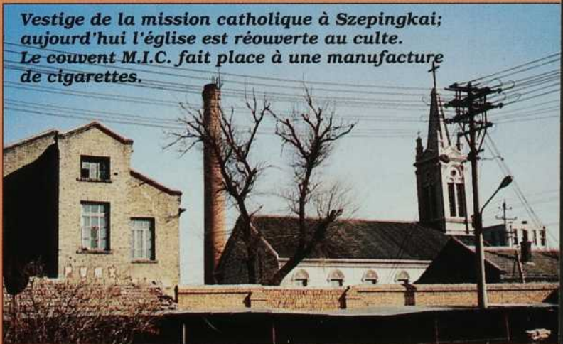
Vestige de la mission catholique à Szepingkai; aujourd'hui l'église est réouverte au culte. Le couvent M.I.C. fait place à une manufacture de cigarettes.