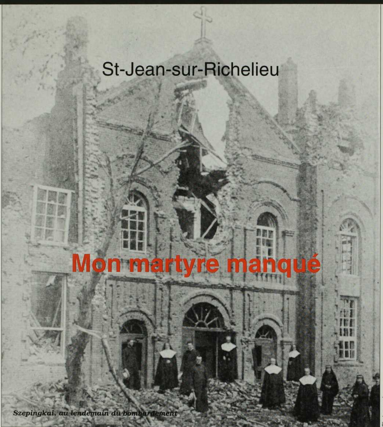
Szepingkai, au lendemain du bombardement