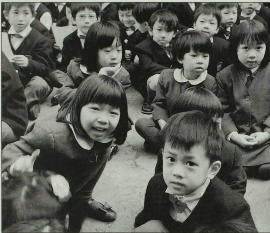
Des valeurs chrétiennes sont inculquées aux enfants.