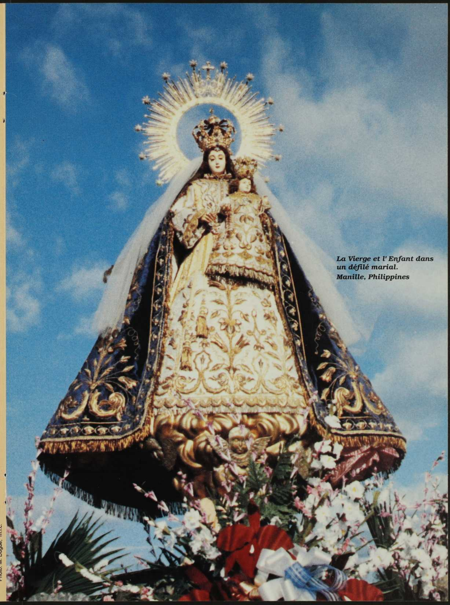
La Vierge et l'Enfant dans un défilé marial. Manille, Philippines