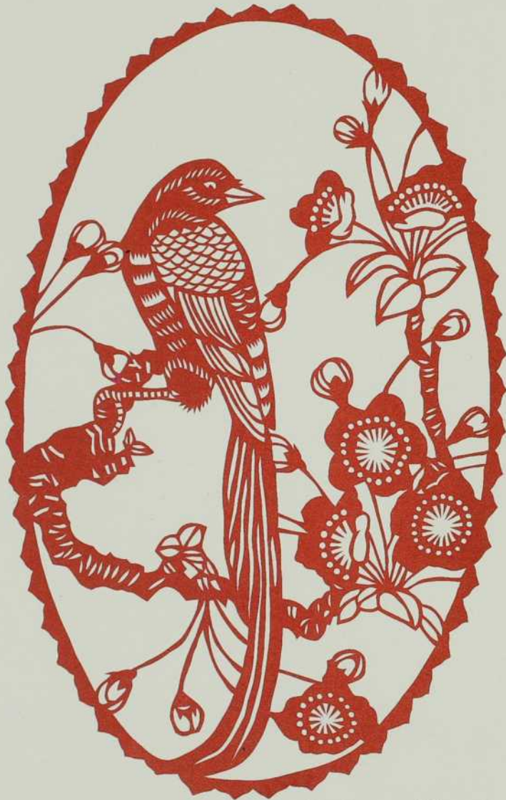
Papier coupé (Paper Cut)

De l'ingéniosité, oui, mais aussi de la patience!!! Les artistes populaires du comté de Pingyang, province de Zeijiang, font du papier coupé (Paper Cut) depuis des centaines d'années.