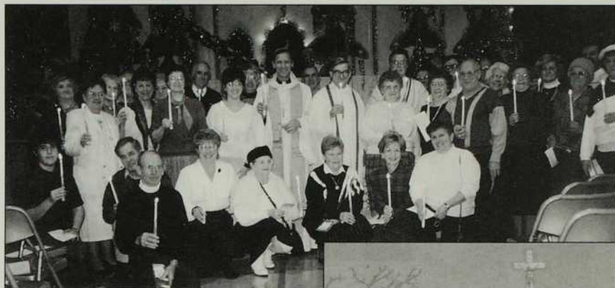
Aujourd'hui, à St-Jean-sur-Richelieu avec le groupe du Renouveau

À ma grande surprise, le lendemain matin les communistes sont repoussés, chassés de la ville par les nationalistes de Pékin. En apprenant ce changement inespéré, ma réaction bien sûr est d'espérance et de consolation. Je