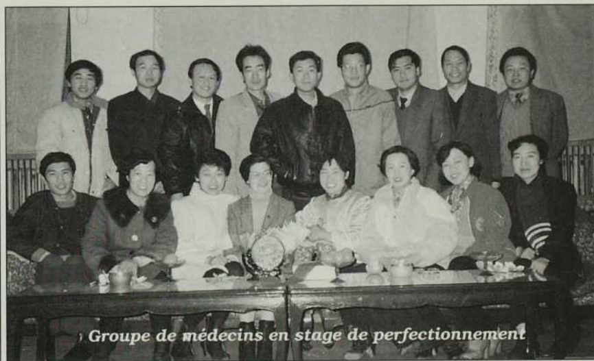
Groupe de médecins en stage de perfectionnement