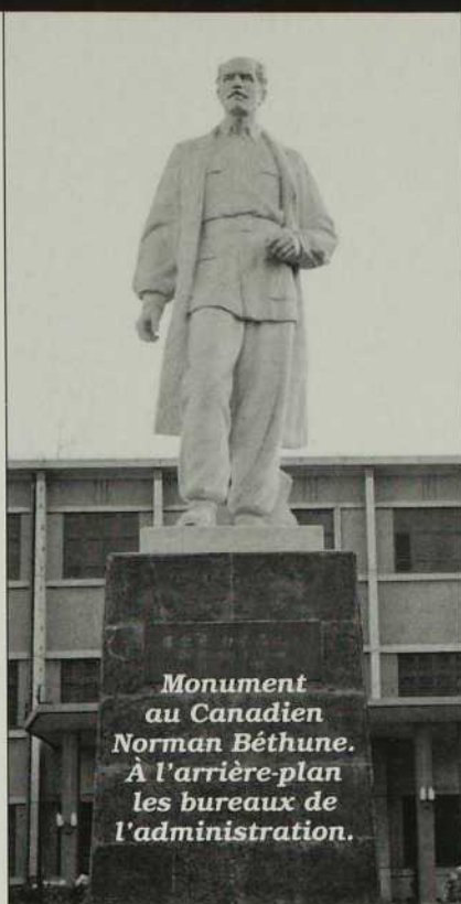
Monument au Canadien Norman Béthune. À l'arrière-plan les bureaux de l'administration.

En Chine rien n'est facile. Toute initiative se bute à d'innombrables difficultés, subit des ajustements répétés, passe par des périodes de