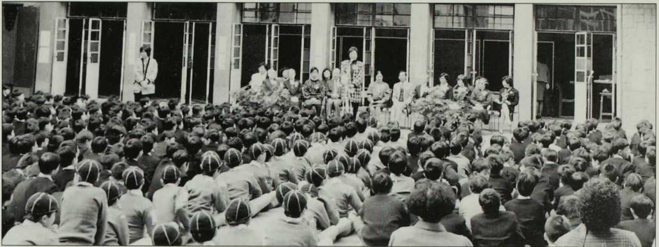
1400 élèves fréquentent l'école.