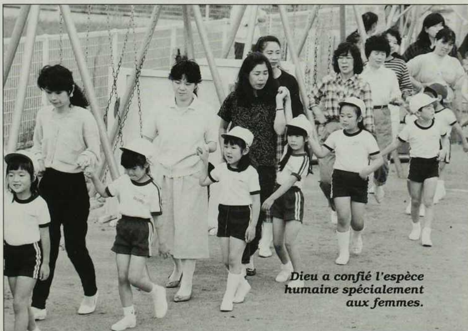
Dieu a confié l'espèce humaine spécialement aux femmes.