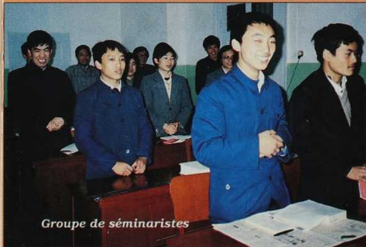
Groupe de séminaristes