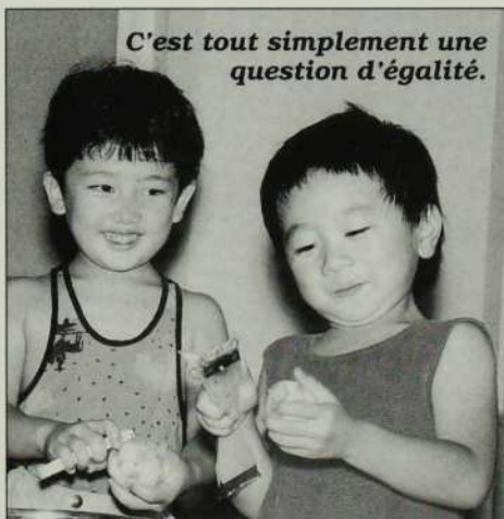
C'est tout simplement une question d'égalité.

Traduit de l'anglais par Christine Desrochers Réf.: The Japan Missionary Bulletin , automn 1991.