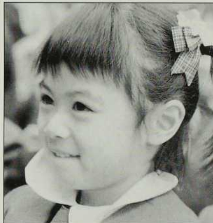
Le slogan "Joie au devoir" apporte une couleur spéciale à la vie étudiante.

spectives d'avenir. Partant de la conviction profonde que la première éducation d'une personne est fondamentale, le personnel de l'école se sent 'en mission' dans la société instable de Hong Kong. L'école a besoin de bons éducateurs à tous les niveaux afin d'assurer une édu-