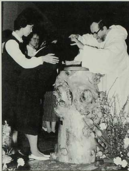
Le baptême fait naître à une vie nouvelle.

"Femmes du monde, que vous soyez chétiennes ou non, à ce point tournant de l'histoire, la vie de l'espèce humaine est entre vos