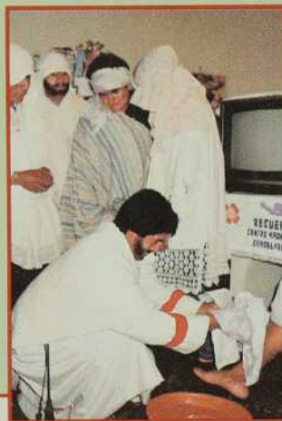
De jeunes comédiens reproduisent le lavement des pieds.

À 15 heures, commence le chemin de la Croix dans les rues. Les femmes ont revêtu leurs vêtements de deuil. Les hommes se font un devoir et un honneur de porter la croix et la statue de Marie également habillée de noir. À chaque station, une famille prépare une table pour y déposer la Sainte Vierge. On offre des fleurs et on fait brûler de l'encens. À 18 heures, nous entrons dans la chapelle et