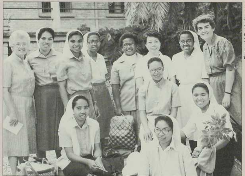
De nombreuses vocations M.I.C. à Madagascar témoignent de la vitalité d'une Église qui a vécu sous un régime socialiste.

Ces quelques réflexions donnent un petit aperçu de ce qu'a été le synode sur la vie consacrée. Comme ce fut le cas pour le Concile, il faudra quelques années pour apprécier les appels du synode à poursuivre notre renouveau. Cette rencontre nous offre une espérance pour entrer dans le 21 e siècle. À nous de saisir cette grâce! □