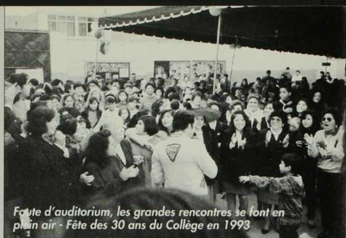
Fête d'auditorium, les grandes rencontres se font en plein air - Fête des 30 ans du Collège en 1993