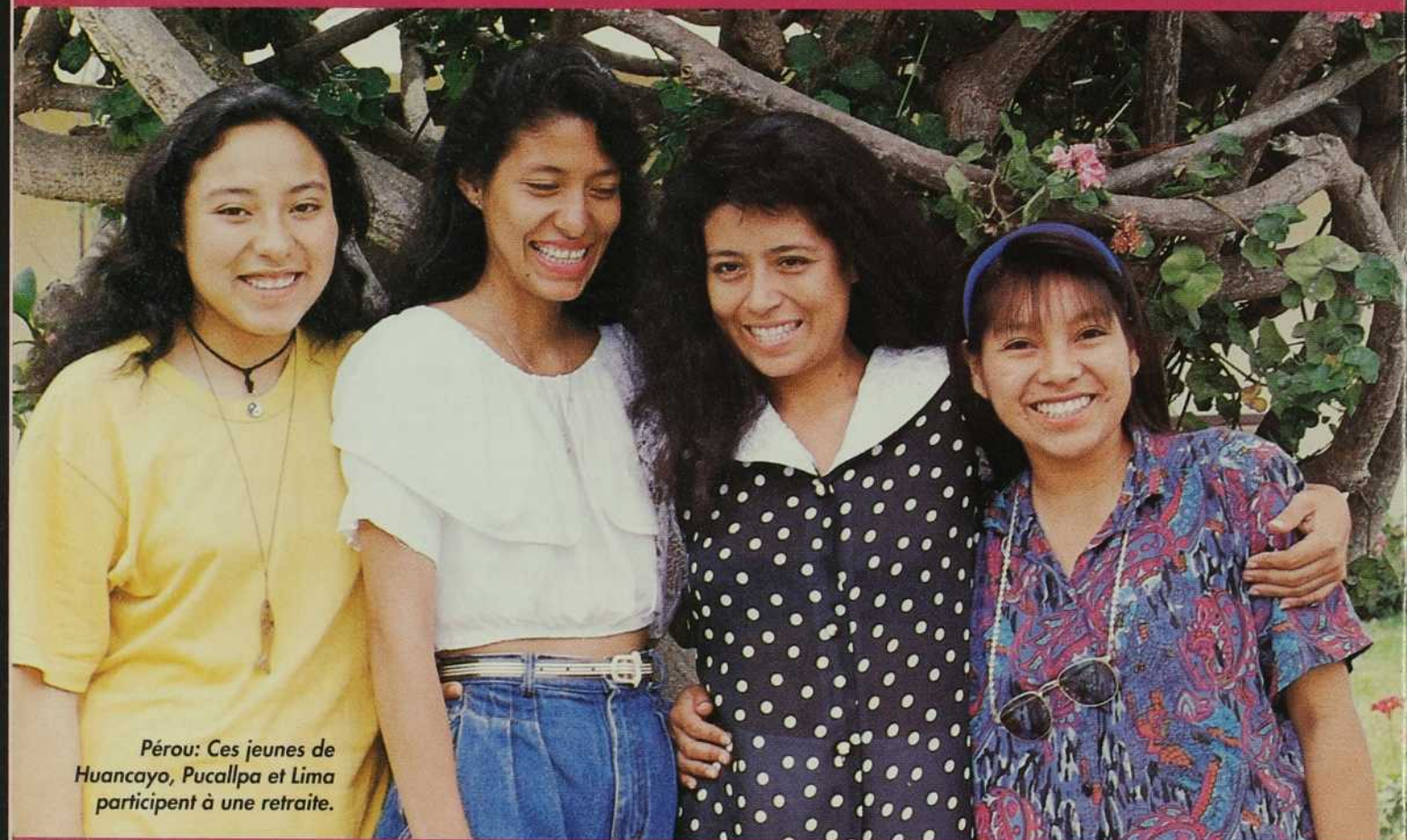
Pérou: Ces jeunes de Huancayo, Pucallpa et Lima participent à une retraite.

La date d'expiration de votre abonnement apparaît au-dessus de votre adresse. Nous vous conseillons de renouveler votre abonnement deux mois avant son expiration. Pour toute correspondance indiquez votre numéro d'abonné. Merci