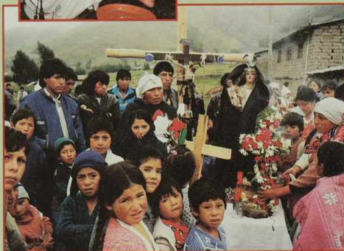
Les chrétiens de Candelaria participent au chemin de la Croix selon leurs coutumes.