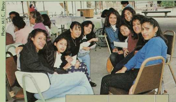
Pour ces JASMIC du Pérou, devenir associées à notre communauté: un appel, une mission.