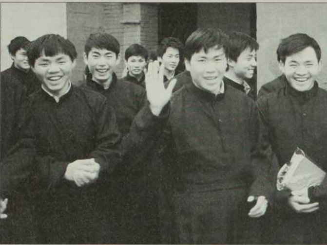
Ces séminaristes en Chine témoignent de la vitalité de la foi.