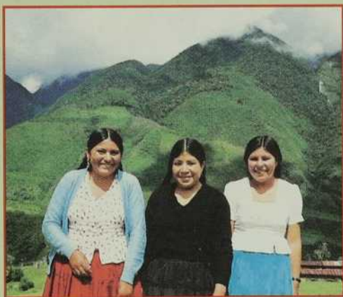
Promotrices laïques de l'Institut d'éducation rurale.

Nous étions bien heureuses d'avoir vécu ces jours saints avec les pauvres, ceux qui sont chers au coeur de Jésus et aussi aux nôtres. J'ai vécu intensément ces journées. Les commodités étaient rares, mais comme j'étais bien dans cette simplicité! J'espère avoir la chance de revivre des expériences semblables, car elles me rapprochent de l'amour de Dieu le Père et de mes soeurs et frères boliviens. □