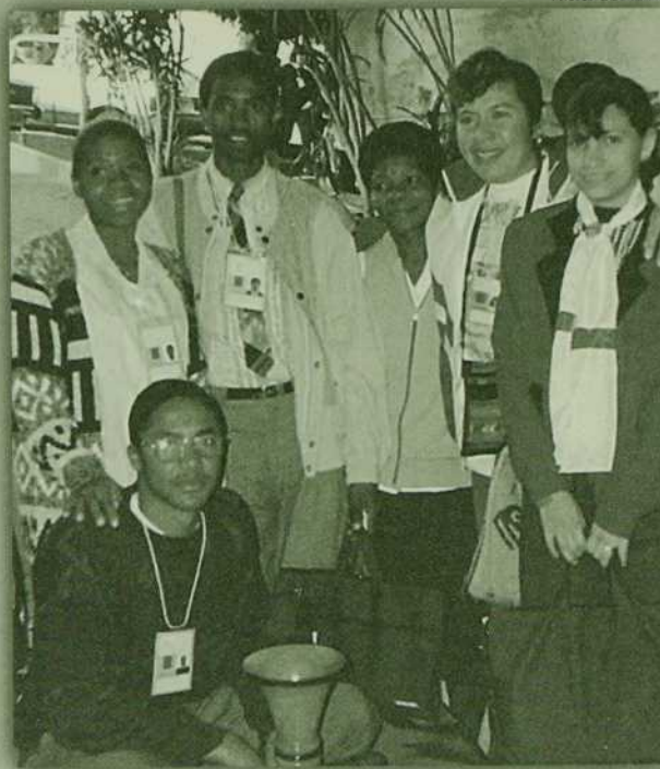
La délégation d'Haïti à COMLA V, au Brésil, en juillet dernier, cherche à adapter les orientations du Congrès à leur Église locale.

Lorsque nous parlons des interventions fermes de la C.H.R. - jusqu'à ce jour toujours présente aux côtés de notre peuple souffrant et luttant pour le respect de ses droits et de sa dignité - il convient de souligner l'apport notable de la radio catholique - "Radio Soleil" établie en 1979. Toujours dans le domaine médiatique, il faut évoquer l'impact du Congrès eucharistique marial (décembre 1981 à mars 1983). Au cours de ces 15 mois de temps fort dans la vie de notre Église, deux choses sont à signaler. D'abord, la tenue et les conclusions du Symposium national de décembre 1982, suite à la proclamation engagée du peuple chrétien d'Haïti: Nou se Legliz; Legliz se nou (Nous sommes l'Église et l'Église, c'est nous!) Au terme du dit symposium, l'épiscopat