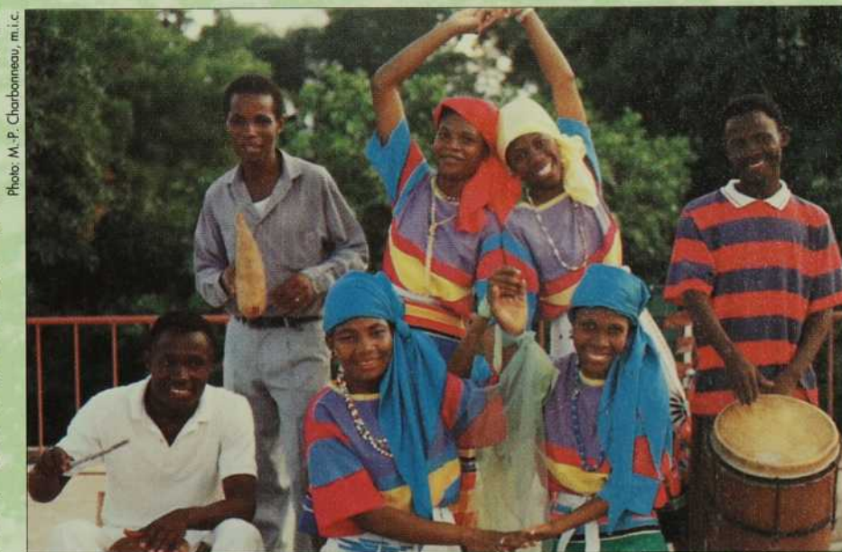
Trouver des chemins de compromis pour vivre dans l'harmonie!

En plus de l'habitude de l'alternance démocratique que favorisera la nouvelle réalité politique en Haïti, ce pays est également libéré d'un poids séculaire qui a toujours handicapé son développement. L'armée d'Haïti, qui modelait tout en fonction des intérêts de ses chefs et de leurs alliés, a disparu de l'horizon politique haïtien. Il reste au nouveau Parlement de consacrer définitivement son effacement. À partir de cette absence de taille, les Haïtiens apprendront à vivre en démocratie, en dehors du poids écrasant de l'institution militaire, avec l'égalité de chance pour tous.