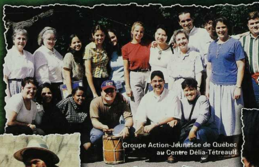
Groupe Action-Jeunesse de Québec au Centre Délia-Tétreault