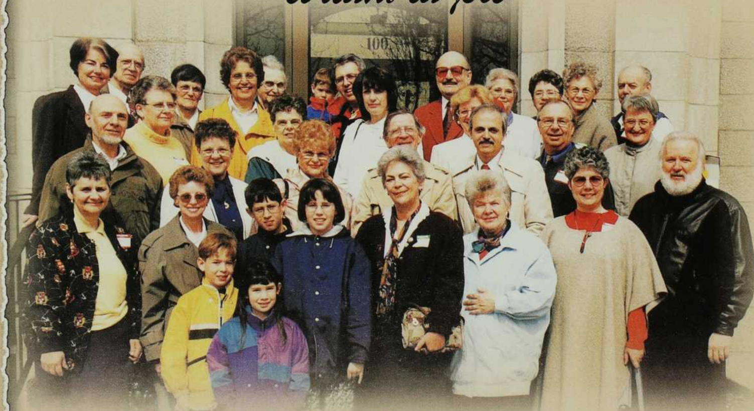
Groupe ASMIC de Laval, Québec, Canada.

Que le Seigneur garde vos cœurs dans l'action de grâces et dans la joie!