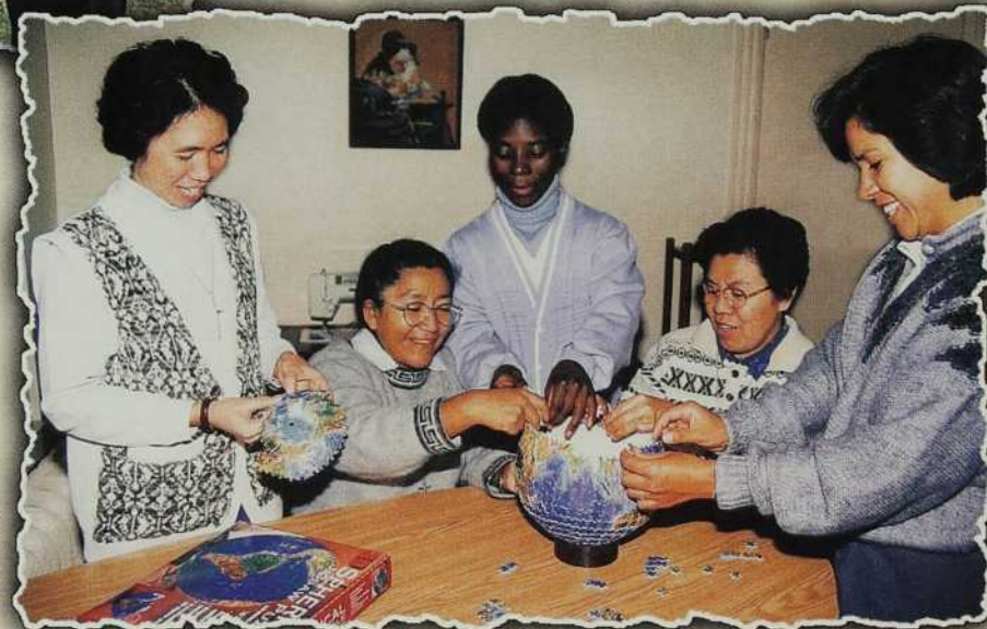
Construire ensemble un monde fraternel. Scolasticat international M.I.C. Canada