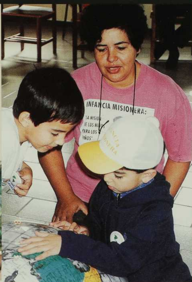
Apprendre à voir le monde comme une grande famille. Enfance missionnaire, Brésil