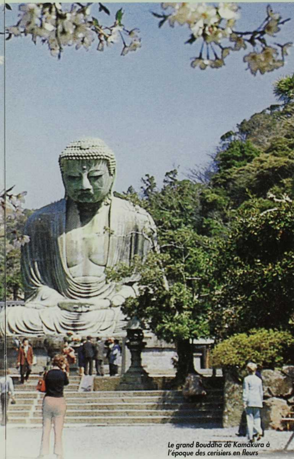
Le grand Bouddha de Kamakura à l'époque des cerisiers en fleurs