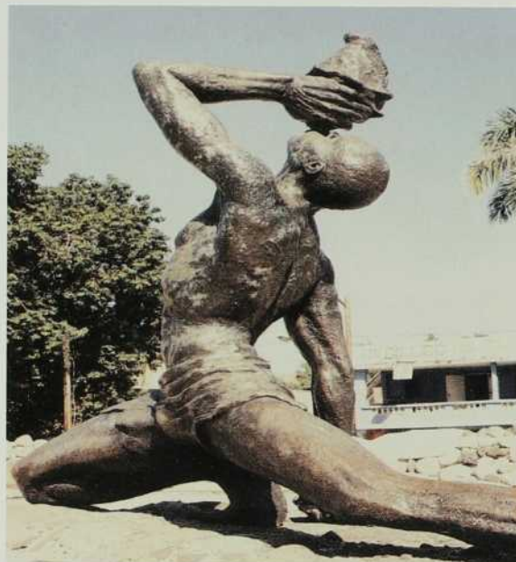
Le nègre marron à Port-au-Prince, symbole de l'indépendance