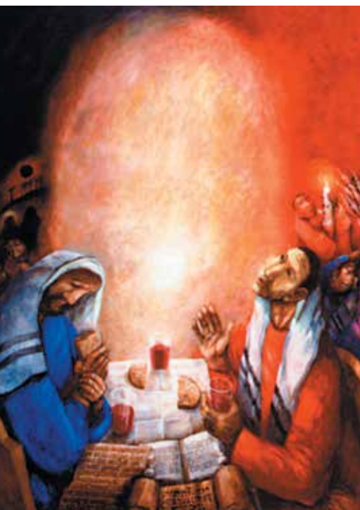
Disciples d'Emmaüs Peinture de Sieger Köder

Dans notre culture, il nous arrive de laisser échapper un TOI, JE NE T'OUBLIERAI PAS LA FACE, une façon de nous souvenir d'une mauvaise affaire. Se pourrait-il que Marie, sur un tout autre ton, pleine de grâce et d'amour, ait formulé au fond de son cœur cette même phrase : TOI, MON FILS, JE NE T'OUBLIERAI PAS LA FACE. ET TOI, MON DIEU, JE RETIENS LA GRANDEUR DE TA BONTÉ ? ∞