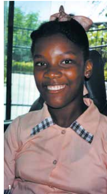
1 Jeune étudiante de l'IMD