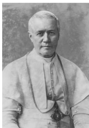
S.S. le Pape Pie X, 1835-1914 Giuseppe Sarto qu'on surnomma Le Pape de l'Eucharistie