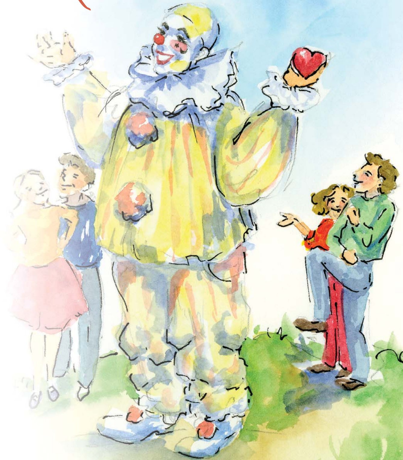
Aquarelle: Geneviève Dick, http://creincarnation.googlepages.com/