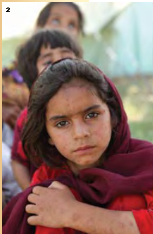
2 Pakistan, enfants déplacés

Ce point de vue, émis par la chef de la délégation du Saint-Siège à la Conférence mondiale sur les femmes de Beijing , ne vient-il pas justifier, en quelque sorte, la raison d'être des actions entreprises par la MMF? La mobilisation à l'échelle mondiale s'avère possible parce que les femmes sont de plus en plus conscientes des profonds déséquilibres existant entre le Nord et le Sud et des disparités entre les hommes et les femmes. Les revendications pour éliminer la pauvreté le montrent bien. La prise de conscience des femmes s'exprime également à travers les revendications sur l'élimination de la