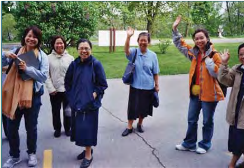
1 Départ de Pont-Viau