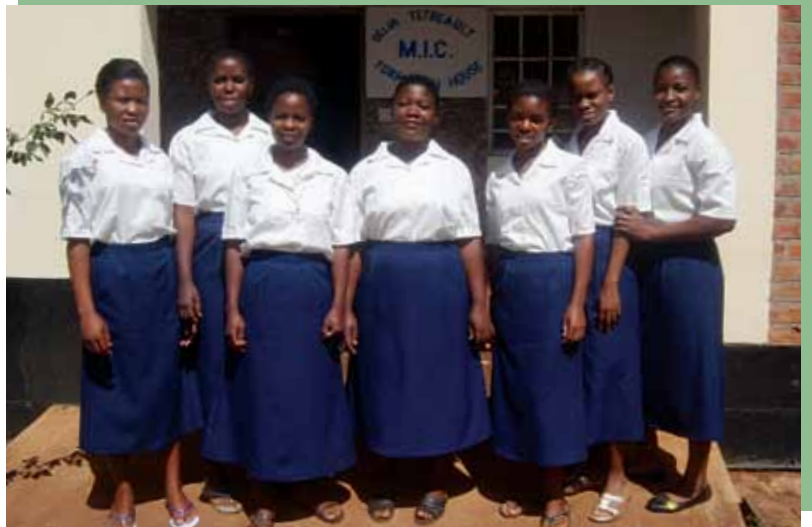
Postulantes du Centre de formation

On me demande maintenant d'aller dans un autre endroit, ma collaboration à cette mission tire à sa fin, mais les religieuses locales responsables de la formation continueront à avoir besoin de soutien matériel et spirituel. Quant à moi, je suis reconnaissante d'avoir travaillé à la formation religieuse à tous les niveaux dans notre province de Notre-Dame d'Afrique. Cette expérience m'a rajeuni le cœur et m'a permis de prendre part à une tâche importante, soit la préparation de jeunes postulantes à servir Dieu et son Peuple. Tout comme Marie, je peux dire : Et mon esprit se réjouit en Dieu mon Sauveur. ☺