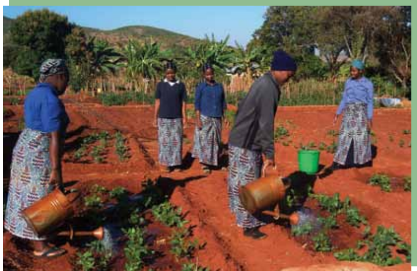
Des postulantes au travail dans le potager