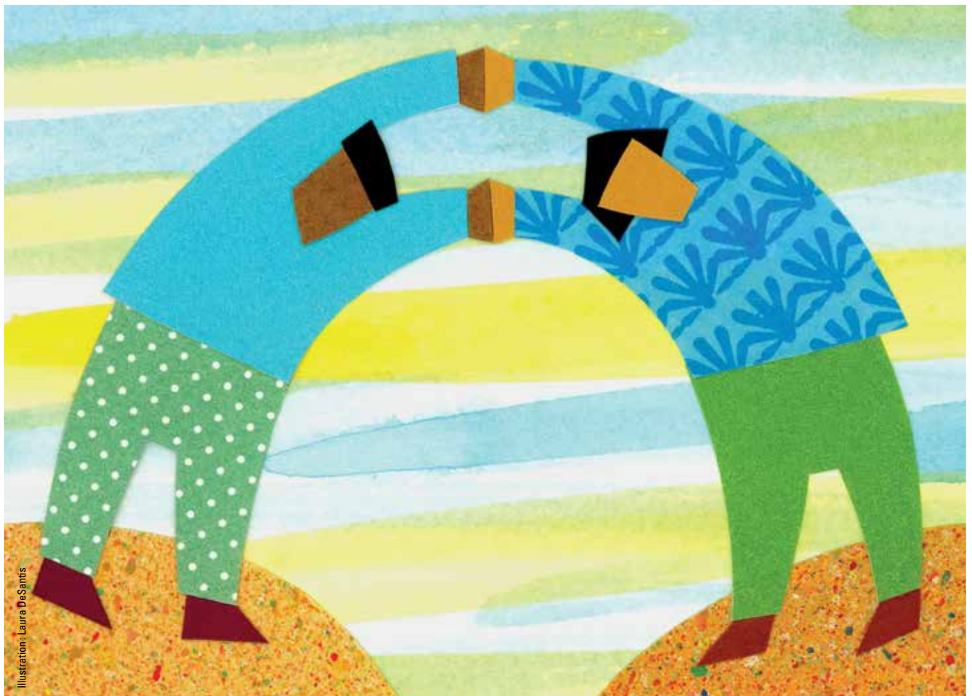
Illustration: Laura DeSantis