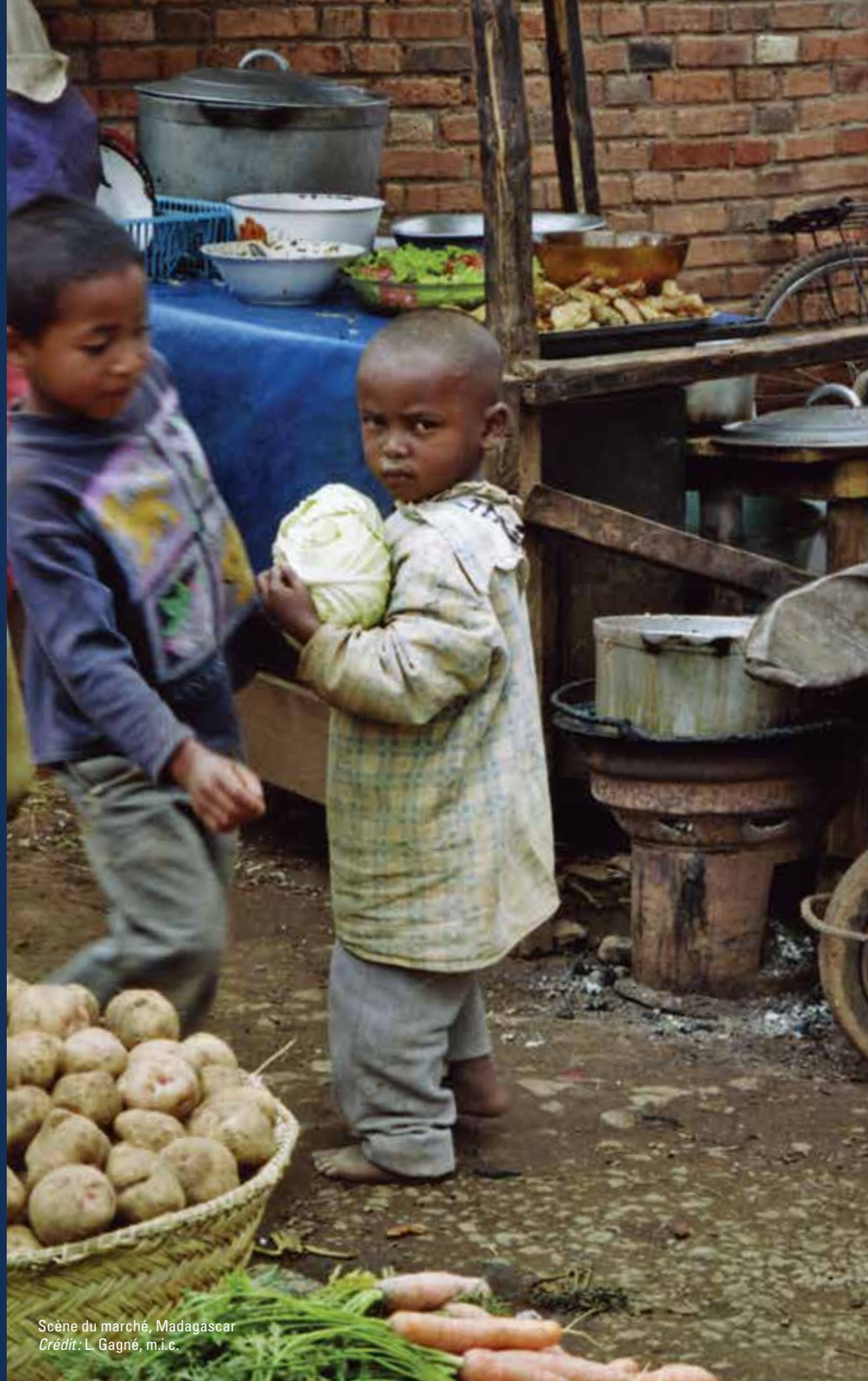
Scène du marché, Madagascar