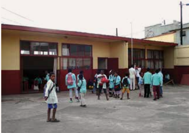
Le Centre d'alphabétisation

Voici ce que nos sœurs malgaches écrivent :