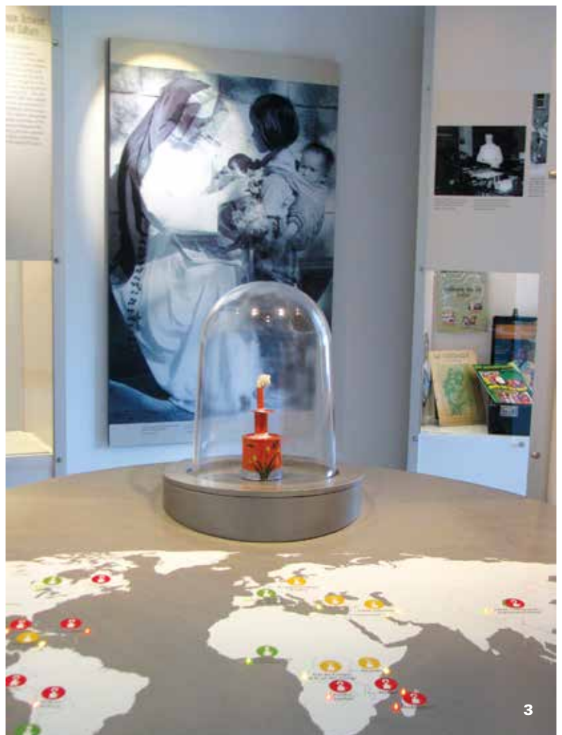
1-2-3 Musée Délia-Tétreault