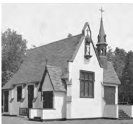
La chapelle du parc Victoria, où la première Œuvre des terrains de jeux s'installe dès 1929 2

Au cours de l'histoire, les missionnaires ont également pratiqué leurs passe-temps même lorsqu'ils étaient de passage ou qu'ils s'établissaient temporairement au Canada. Ils ne se cachaient pas pour pratiquer leurs activités, mais ils y intégraient également des laïques. Prenons l'exemple de l' Œuvre des terrains de jeux qui offrait une panoplie de sports et de loisirs estivaux aux jeunes catholiques québécois jusque dans les années 1960. Au cours d'une semaine consacrée aux missions, des missionnaires venaient présenter des films et partager leur passion pour le chant, les sports, le dessin, etc.