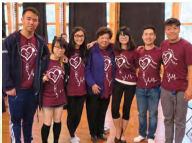
Sr Cecilia et les organisateurs du camp