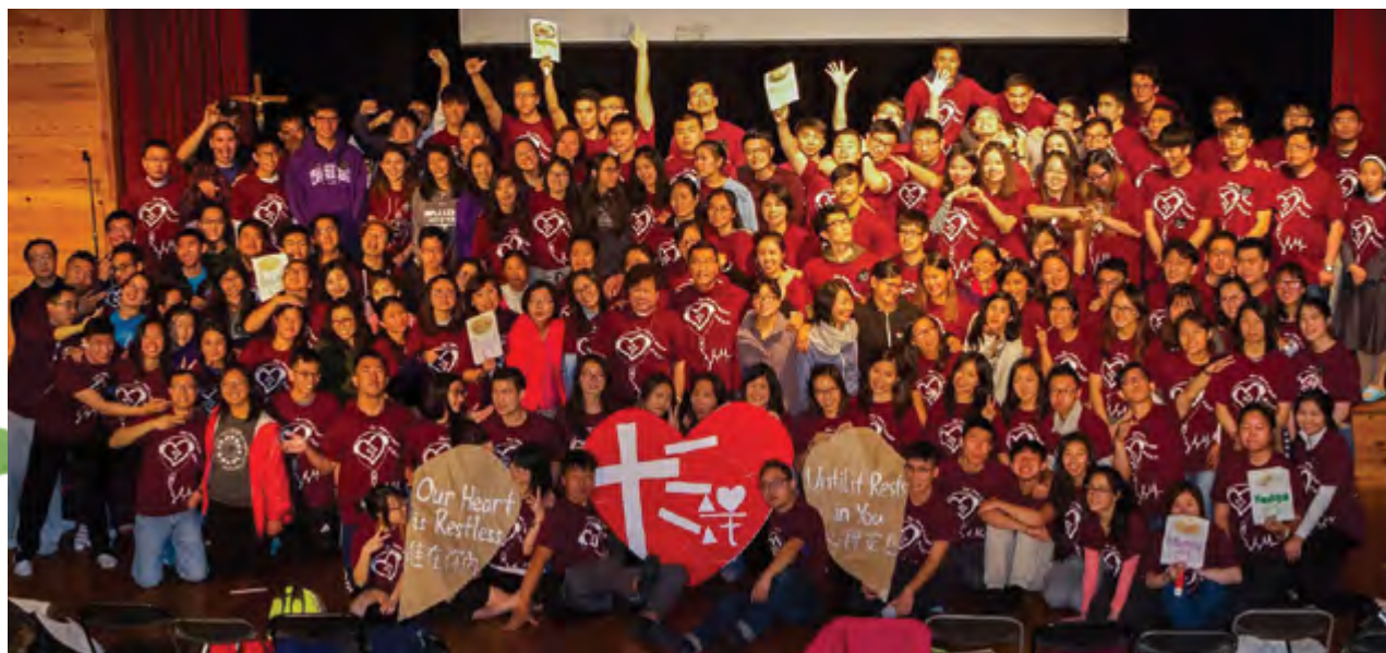
41 e Camp de la Jeunesse chinoise catholique canadienne de Harriburton, Ontario, 2017 / Crédit: Jason Wong (photo prise avec un drone)